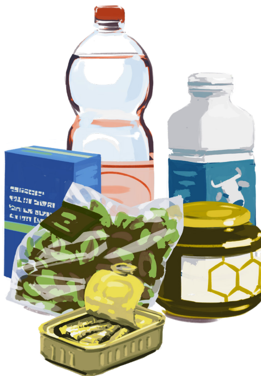
Mikroplastik aus Lebensmitteln und Verpackungsabrieb wird über die Nahrung aufgenommen.

Auf Bundesebene gilt das Vorsorgeprinzip (Art. 1 Abs. 2 Umweltschutzgesetz), so dass die Kunststoffeinträge in die Umwelt aufgrund ihrer schlechten Abbaubarkeit so weit wie möglich zu reduzieren sind. Die Postulate Thorens Goumaz [32] und Munz [33] aus dem Jahre 2018 verlangen die Prüfung eines Aktionsplans zur Reduzierung von Plastikeinträgen in die Umwelt und eines zukünftig ökologischen, effizienten und wirtschaftlich rentablen Umgangs mit Kunststoffen. Diese Postulate lehnen sich eng an die Strategie der europäischen Kommission zu Plastik an (siehe unten). Der Bundesrat erachtet die Erarbeitung eines Aktionsplans im Bereich Kunststoffe aufgrund bereits laufender Arbeiten wie der parlamentarischen Initiative UREK-N (20.433) «Stärkung der Kreislaufwirtschaft in der Schweiz», nicht als notwendig. Das gut funktionierende Abfallbewirtschaftungssystem ist ein zentraler Pfeiler, welcher den Plastikeintrag in die Schweizer Umwelt bereits heute reduziert. Der Bund hat zusammen mit den Kantonen, privaten Organisationen und mittels Branchenlösungen Massnahmen zur Bekämpfung von Littering (z.B. Verbesserung der Entsorgungsinfrastruktur im öffentlichen Raum), der Reduktion des