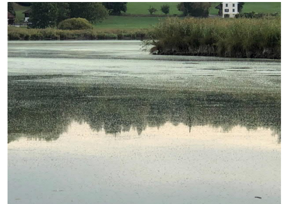
Abb 2a und b: Lützelsee 28. August 2018, Aphanizonemon flos-aquae