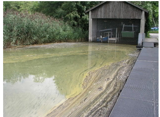
Abb 1a und b: Greifensee 10. August 2011; Microcystis aeruginosa