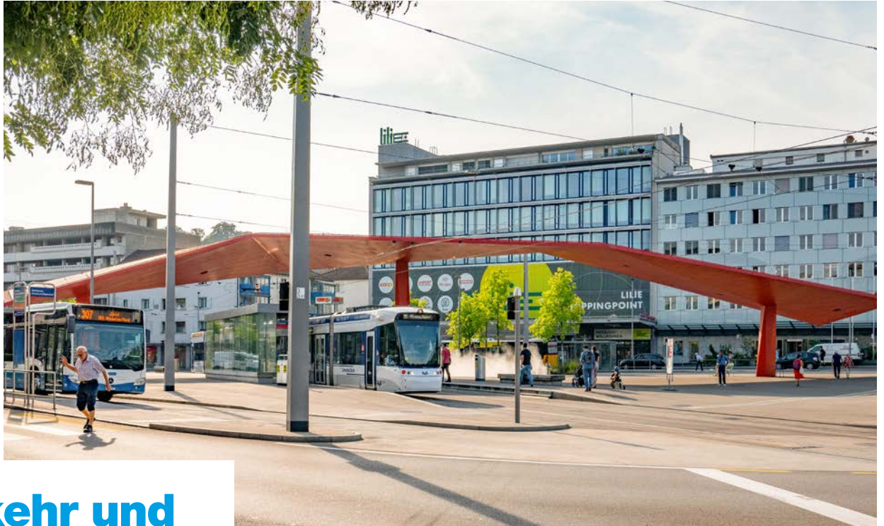
Ein Beispiel, das auf verschiedenen Ebenen Wirkung zeigt: Die Limmattalbahn am neuen Stadtplatz Schlieren – mit dem markanten roten Flügeldach.