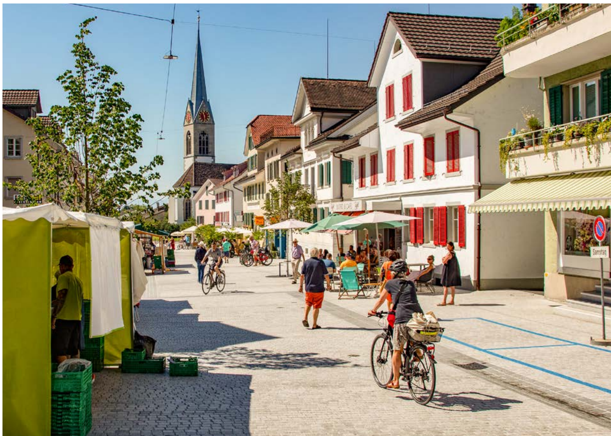
Begegnungszone statt Durchgangsstrasse: Mehr Raum für Aufenthalt und Begegnung auf der Seestrasse in Pfäffikon.

Die Umsetzung der Agglomerationsprogramme gelingt vor allem dort, wo Gemeinden frühzeitig planen, koordinieren und Synergien nutzen. Die folgenden Punkte sind zentral für den Erfolg.