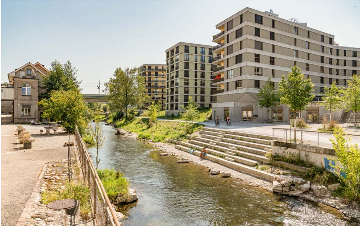
Fil Bleu: Ein grünes Band entlang der Glatt – Erholung am Wasser und sichere Wege für alle.