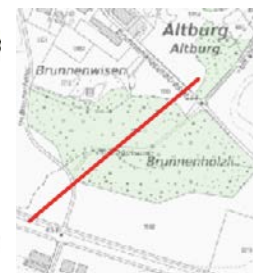
Das Höhenprofil visualisiert den Geländeverlauf der gemessenen Strecke.