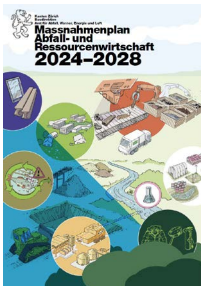
Im «Massnahmenplan Abfall- und Ressourcenwirtschaft 2024–2028» legt der Kanton seine Handlungsfelder und Massnahmen fest und beurteilt den aktuellen Stand.

Quelle: Massnahmenplan Abfall- und Ressourcenwirtschaft 2024–2028, www.zh.ch/abfall-rohstoffe → Abfallplanung