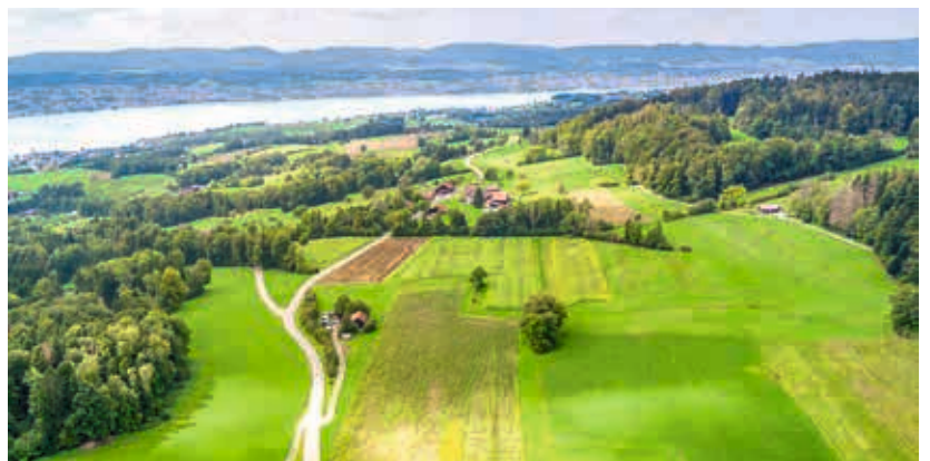
Heckenlandschaft Bezibüel bei Meilen. Die markanten Hecken schützen die Felder und Wiesen vor Austrocknung, Wind und Erosion.

Im Kanton Zürich gibt es insgesamt rund 202'200 Wohngebäude. In den inventarisierten Landschaftsschutzobjekten befinden sich nur 6640 von ihnen und somit ein Anteil von 3,3 Prozent. Die inventarisierten Landschaftsschutzobjekte nehmen zwar rund einen Drittel der Kantonsfläche ein, es handelt sich jedoch vor allem um sehr spärlich besiedelte Flächen.