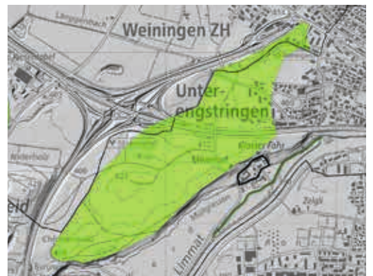
Beeinträchtigung der Endmoräne des Schlieren-Stadiums im Limmattal durch eine Infrastrukturbauete.