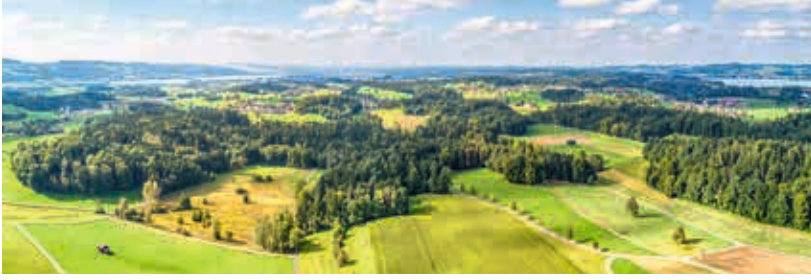
Gossauer Drummlins Altenberg, Schinberg, Fuchsloch, Schnätzelsrüti, Buechholz. Solche charakteristischen Landschaften sollen auch künftigen Generationen erhalten bleiben.