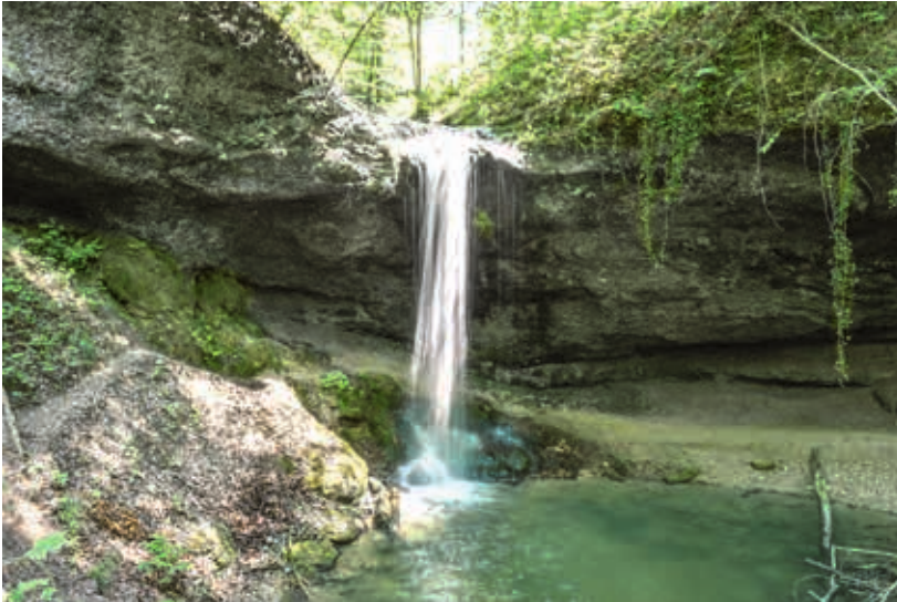
Die Gewässerlandschaft «Bächtalbach und Tüfels Chilen» ist ein wunderbares Ausflugsziel. Ein sehr beliebter Wanderweg führt durch das Rörlietobel zur Tüfels Chilen und weiter nach Kollbrunn. Auf dem Weg ins Rörlietobel stürzt der Bächtalbach über eine Nagelfluh-Geländestufe. Ein bachbegleitender Wasserlehrpfad liefert interessante Informationen zur Wanderung.