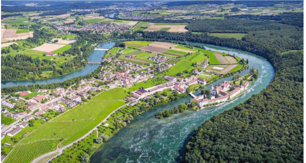
Zürcher Rheinufer bei Rheinau. Bei den Gewässerlandschaften ist das Element Wasser formgebend und prägend.