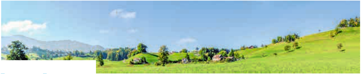
Moränenzug von Hütten, geomorphologisch geprägte Landschaft.