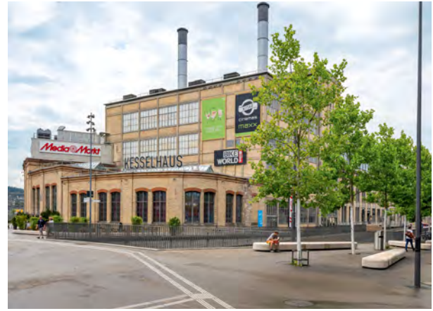
Beispiel für die Siedlungsentwicklung nach innen: Umnutzung einstiger Industrieflächen auf dem Winterthurer Sulzerareal wie beispielsweise das Kesselhaus im Jahr 2008 (links), noch vor dem Umbau zu einem modernen Multiplexkino (rechts).

Wäre das Siedlungsgebiet überall im Land so schnell gewachsen wie im Kanton Zürich, so hätte der Flächenverbrauch seit den Achtzigerjahren rund 1.6 Quadratmeter pro Sekunde betragen. Die Zürcher Siedlungsexpansion verlief also deutlich schneller als im Schweizer Mittel.