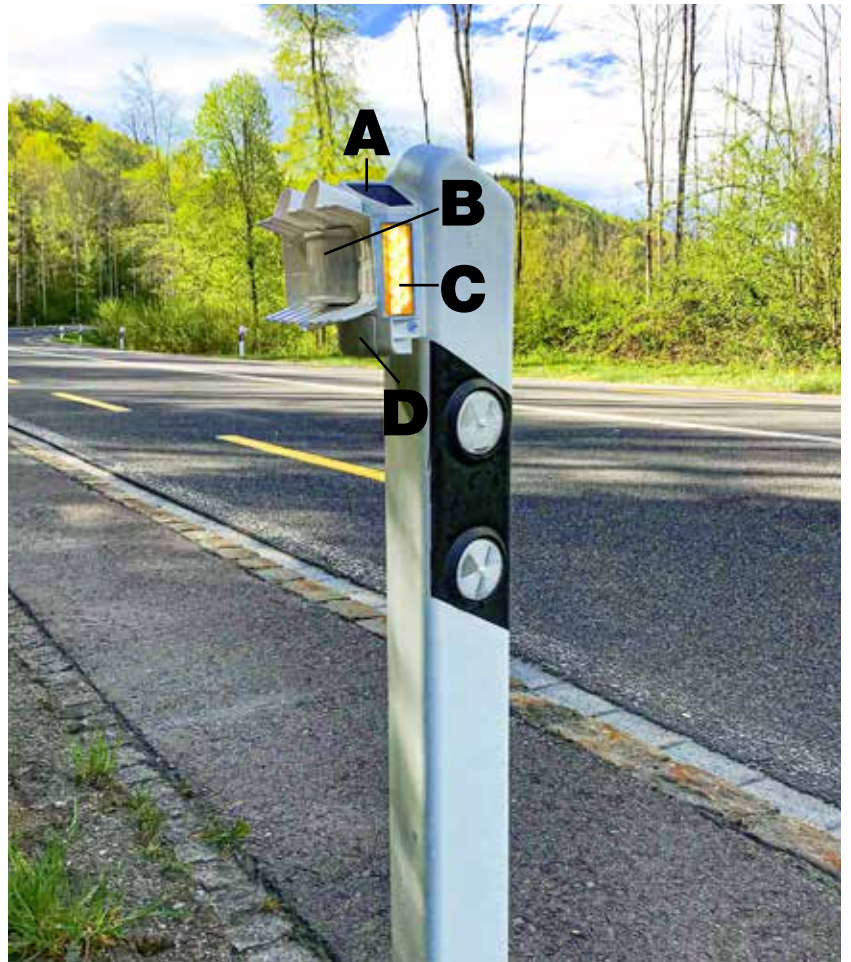
Die Module der Wildwarnanlage werden an die weissen Strassenleitpfosten mit einem maximalen Abstand von 50 Metern montiert. Die Hauptbestandteile eines Moduls sind: A) Solarmodul, B) Erkennungssensor, C) LED-Warnsignal und D) Akkufach und Speicherung der Daten.