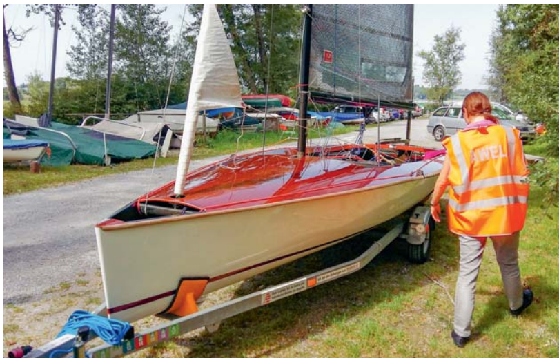
Die Kontrolle vor Ort zeigt, ob Boote ausreichend gereinigt worden sind.

der Tiere winzig und können leicht übersehen werden. Während der Projektdauer mussten daher Boote und Ausrüstungen vor dem Einwassern in den Pfäffikersee sorgfältig gereinigt werden. Sowieso verboten ist es, lebende Köderfische, Aquarien- und Gartenteichbewohner auszusetzen. Wie aber kann man alle Nutzerinnen und Nutzer des Gewässers am besten für diese Zusammenhänge sensibilisieren?