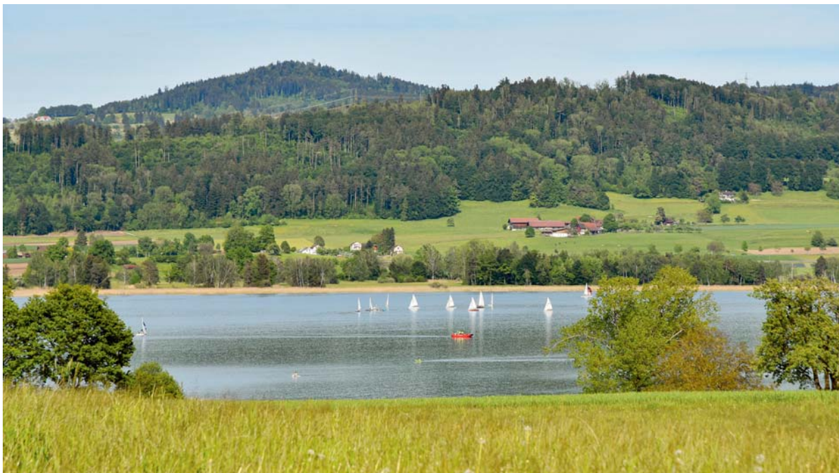
Ein schöner Tag lockt Spaziergänger, Fischerinnen, Segler und Paddler in das Naturschutzgebiet am Pfäffikersee.

tionsflyer kamen generell gut an. Es zeigte sich, dass ein regelmässiger, aber wohl dosierter Versand zentral ist. Die empfohlenen oder angeordneten Vorbeugungsmassnahmen wurden von den Nutzern auch grösstenteils angewendet. So gaben etwa die meisten Segler und Fischerinnen, die regelmässig auf anderen Gewässern unterwegs sind, an, dass sie ihre Boote und Fischereigeräte immer reinigen, wenn sie das Gewässer wechseln.