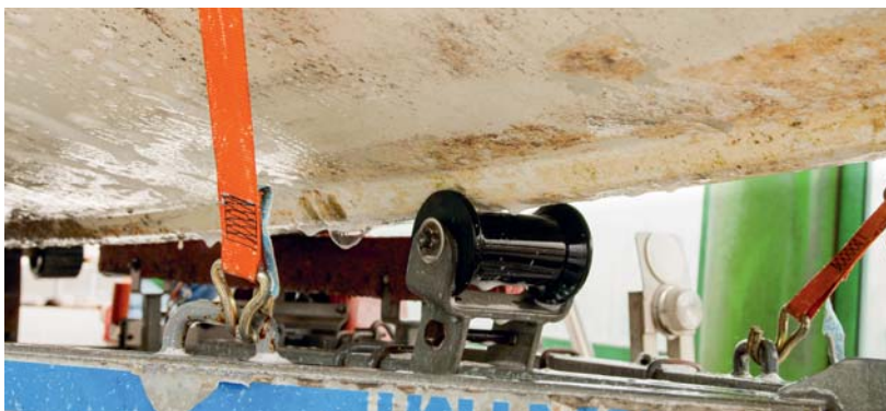
Oben: Bootsbooden mit Bewuchs vor der Reinigung. Unten: Nach der Reinigung.