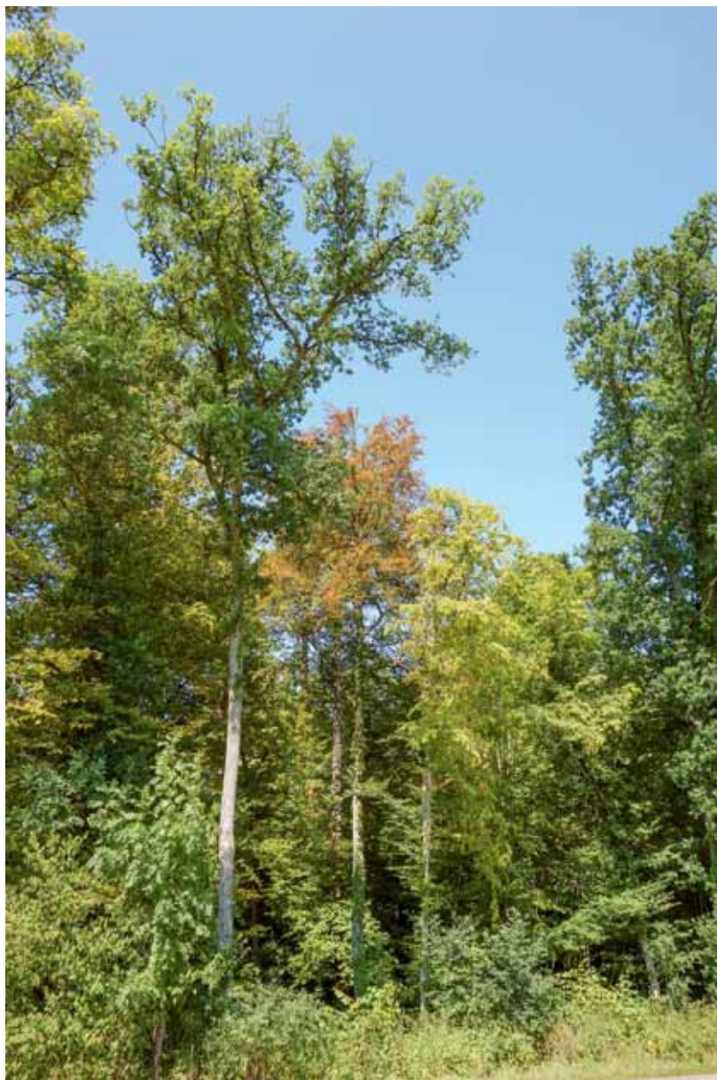
Waldrand in Bülach am 25. Juli 2018: Während die Eichen trotz Trockenheit grün im Saft stehen, zeigen die Buchen, die weniger tief wurzeln, zum Teil bereits im Sommer eine herbstliche Blattfärbung.

Der extrem trockene Sommer 2018 war ein ausserordentliches Ereignis. In dieser ZUP erläutern mehrere Artikel die Auswirkungen auf Landwirtschaft, Gewässer, Fische, sensible Lebensräume und Arten, Wald, Boden sowie Betriebe und zeigen Massnahmen für die Bewältigung künftiger derartiger Sommer (Seiten 5-28).