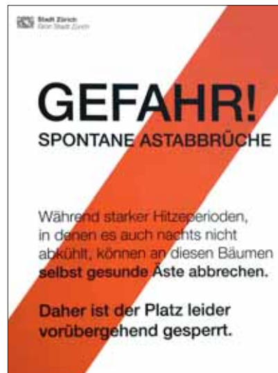
Wie diese Gefahrentafel der Stadt Zürich zeigt, bestand nicht nur Brandgefahr.