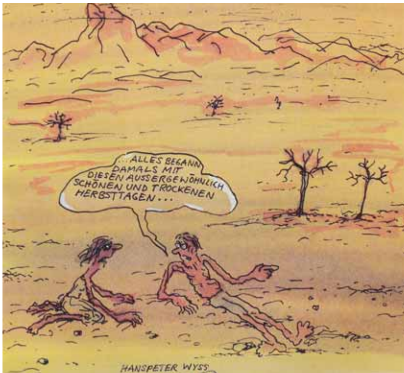
Über die Anpassungsfähigkeit der Wälder an künftige Veränderungen kann man nur spekulieren.