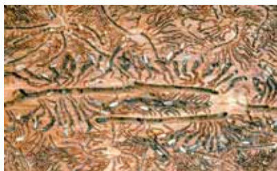
Wegen der charakteristischen Frassspuren wird der Borkenkäfer auch Buchdrucker genannt.

Durch Trockenheit gestresste Bäume wachsen nicht nur schlechter, sie sind auch weniger widerstandsfähig und somit anfälliger für Krankheiten und Schädlinge. Ein bekanntes Beispiel für den engen Zusammenhang von Trockenheit, Wärme und Waldschäden sind die Borkenkäfer, allen voran der Buchdrucker an der häufigsten Nadelbaumart Fichte. Während eine vitale Fichte anbohrende Borkenkäfer durch Harzfluss abwehren kann, ist ein trockengestresster Baum den Käfern weniger gut gewachsen. Neben den reduzierten Abwehrmöglichkeiten des Baums ist auch die Anzahl der Borkenkäfer für die erfolgreiche Besiedelung eines Baums massgebend.