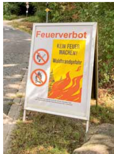
Bei einem Feuerverbot bringen die Revierförster an Waldeingängen und Feuerstellen Plakate an.

Die Populationen des Buchdruckers waren bereits 2017 relativ gross (Grafik Seite 19). Dann fegte Anfang Januar 2018 der seit Lothar stärkste Sturm in der Schweiz – der Wintersturm «Burglind» – über das Land und sorgte für reichlich vorhandenes Brutmaterial für den Borkenkäfer. Im Kanton Zürich betrug die Schadholzmenge rund 145 000 Kubikmeter, wobei es sich bei drei Vierteln des Schadholzes um Fichten handelte (in einem normalen Jahr werden zwischen 400 000 und 500 000 Kubikmeter Holz geschlagen). So waren die Vermehrungsmöglichkeiten für die Borkenkäfer bereits Anfang 2018 beinahe ideal. Der markante Temperaturanstieg im Frühjahr und die folgende Sommertrockenheit waren folglich die Ursache dafür, dass viel mehr Bäume durch den Käfer befallen wurden und vorzeitig als «Käferholz» geschlagen werden mussten. Die Käfer profitieren auch direkt vom warmen trockenen Klima, da die Entwicklungsgeschwindigkeit der Larven temperaturabhängig ist. So konnten 2018 drei Borkenkäfergenerationen heranwachsen, während im «Normalfall» nur zwei Generationen pro Saison möglich sind.