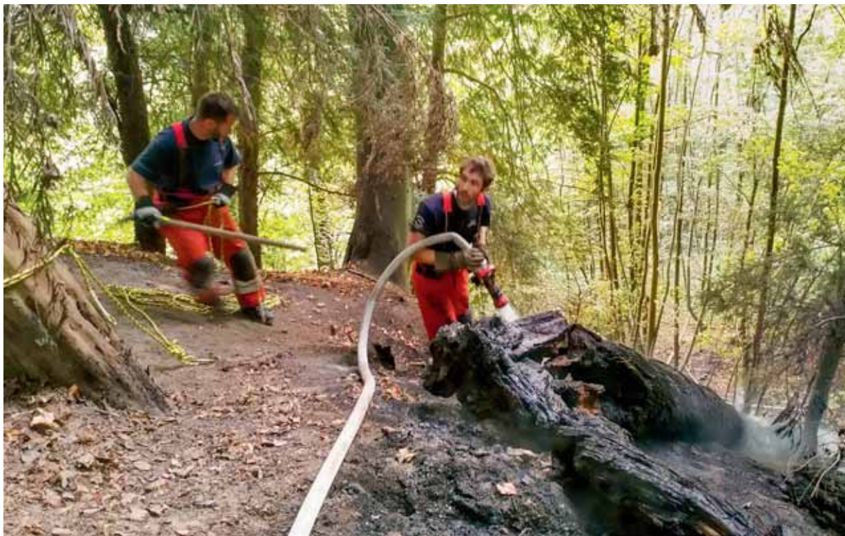
August 2018: Die Feuerwehr brauchte Stunden, um die 2000 Quadratmeter grosse Brandfläche am Osthang des Uetlibergs zu löschen.