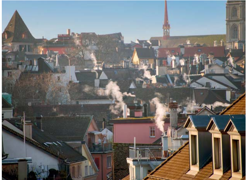
Fossile Heizungen dominieren bei Altbauten weiterhin.