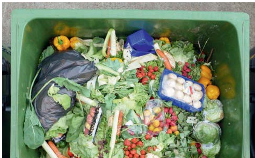
Enthalten biogene Abfälle Plastikanteile, entstehen daraus schwierig verkäufliche Produkte schlechter Qualität.

Wenn die Produkte aus biogenen Abfällen längerfristig eine Chance auf dem Markt bekommen sollen, braucht es dafür Massnahmen: einerseits zur Verbesserung und Sicherung der Qualität, andererseits aber auch intensive Arbeit am Image und an der Aufklärung der Kunden. Ein erster Schritt könnte die Weiterentwicklung der schweizerischen Qualitätsrichtlinie aus dem Jahr 2010 sein, indem sie auch für Kompost-Erdenmischungen gilt, damit dieses eher junge Marktfeld durch gute Qualität ein besseres Image der Produkte ermöglichen kann.