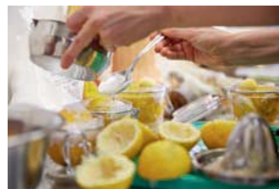
Lebensmittel konservieren kann der Verschwendung entgegenwirken.