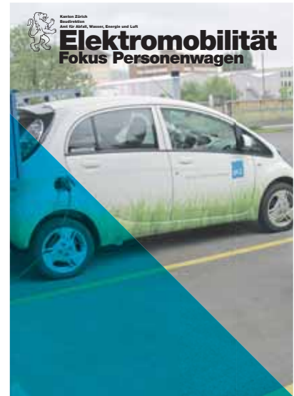
Die soeben erschienene achtseitige Broschüre des AWEL beleuchtet verschiedene Aspekte der Elektromobilität. www.energie.zh.ch - Veröffentlichungen

Schliesslich kann die Gemeinde elek- trisch angetriebene Fahrzeuge anschaf- fen und die entsprechende Lade- infrastruktur für ihre Mitarbeitenden bereitstellen.