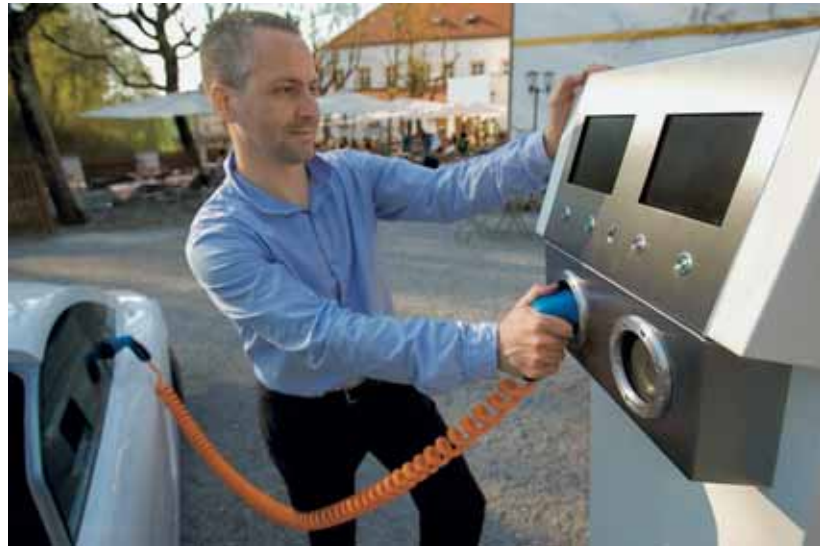
Aufladebeginn eines Elektrofahrzeugs an einer öffentlich zugänglichen Ladestation.

Ansprechstellen: – Verband Suisse e-Mobility – Elektrizitätswerke des Kantons Zürich – Lokaler Stromnetzbetreiber – www.schnellladen.ch/stromtankstellen-verzeichnis