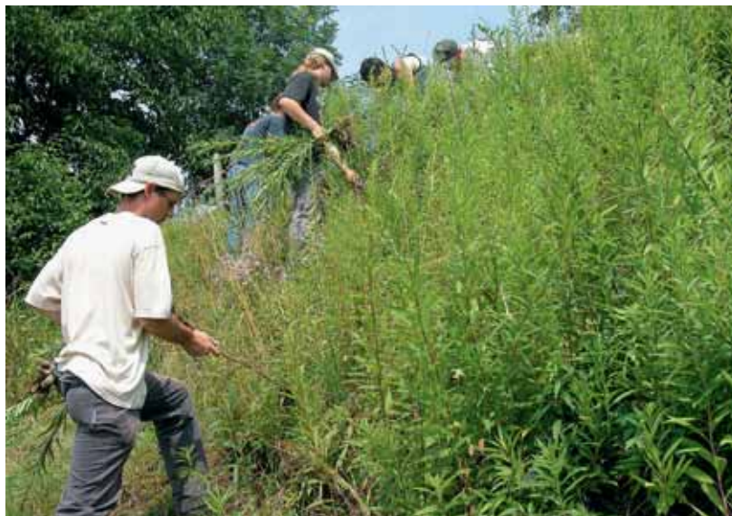
Einige wenige gebietsfremde Arten breiten sich massenhaft aus. Diese invasiven Neobiota können grosse Probleme und Kosten verursachen und müssen eingedämmt werden. Im Bild: Bekämpfung von Goldruten.

Liste der Neobiota-Kontaktpersonen: www.neobiota.zh.ch → Gemeinden