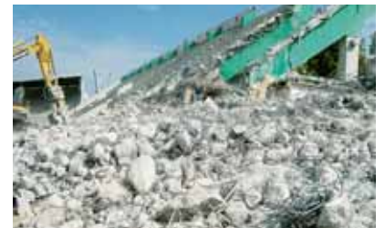
Aus Bauabfällen kann neue Bausubstanz werden – wenn Schadstoffe noch vor dem Rückbau sorgfältig ausgewiesen und separiert werden.