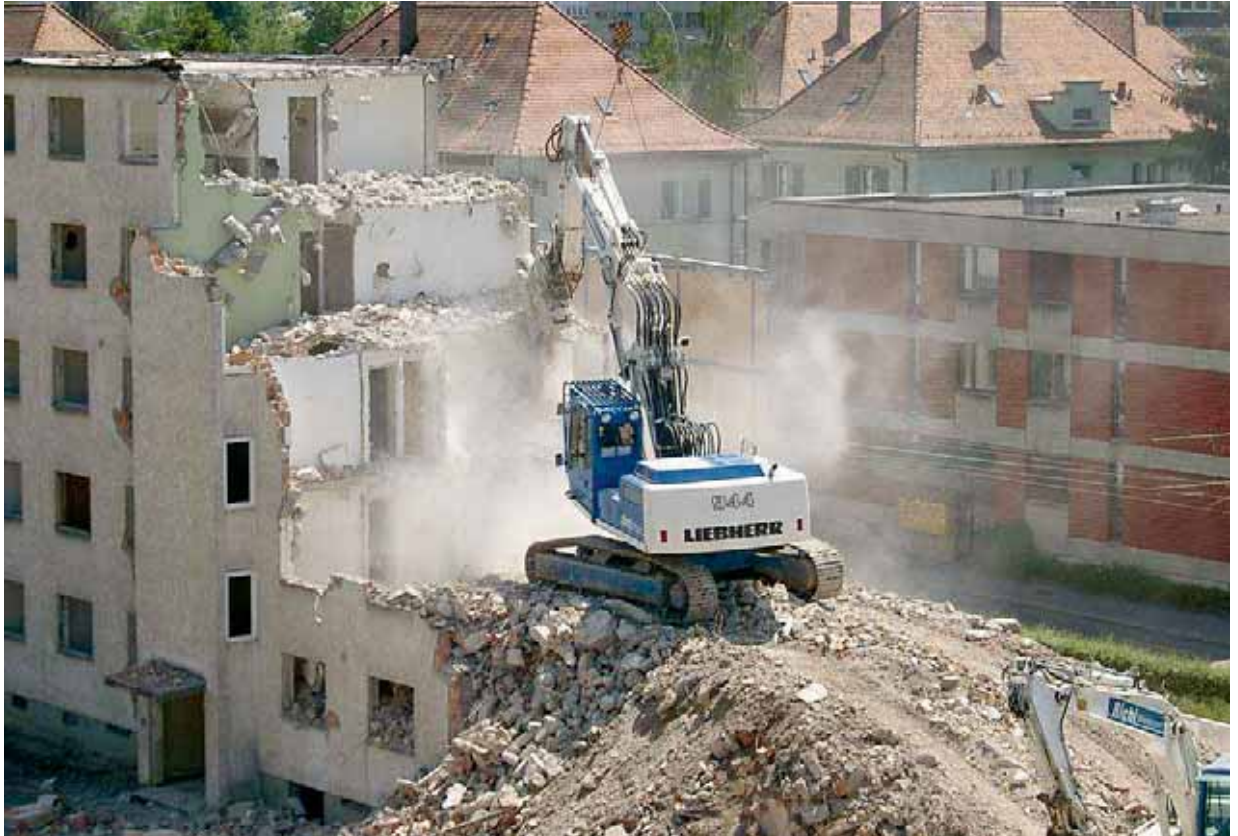
Schadstoffbelastete Gebäudesubstanz muss vor Rück- und Umbauten ausgewiesen und korrekt entsorgt werden.

Die Pflicht zum fachgerechten Umgang mit Schadstoffen ist auch in der Bauarbeitenverordnung BauAV geregelt (Art. 3 Abs. 1bis, und 60 ff. BauAV). Das Entsorgungskonzept dient dem Arbeitgeber als Grundlage, die Gefahren für die Arbeitnehmenden zu beurteilen und notwendige Massnahmen zu ihrem Schutz einzuleiten. Besonders wichtig ist das, wenn sehr gefährliche Schadstoffe wie Asbest vorkommen, die bei Umbau- oder Rückbauarbeiten freigesetzt und eingeatmet werden können. Die Erarbeitung von Entsorgungskonzepten erhöht die Planungssicherheit