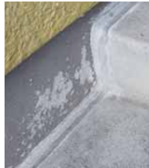
Schadstoffe verstecken sich in alter Bausubstanz an den verschiedensten Stellen. Nur Fachleute wissen, wo sie zu finden sind.