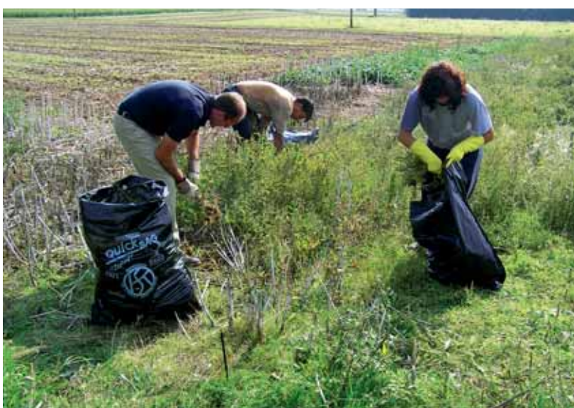
Ambrosia hatte im landwirtschaftlichen Gebiet bereits grosse Bestände gebildet, jäten von Hand kam nur bei kleinen Beständen in Frage.