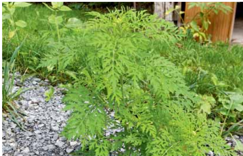
Die Ambrosie wächst unter anderem gerne auf Kies.