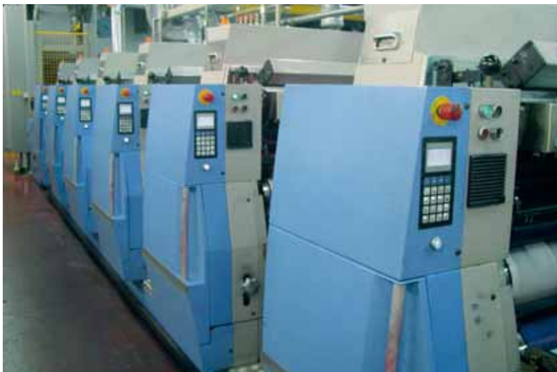
Die nach der Beratung getroffenen Optimierungen lohnen sich für das Druckunternehmen und reduzieren die Produktionskosten.

Mit einer Effizienzberechnung konnten die Reffnet-Experten zeigen, dass sich die Investition in den neuen elektri-