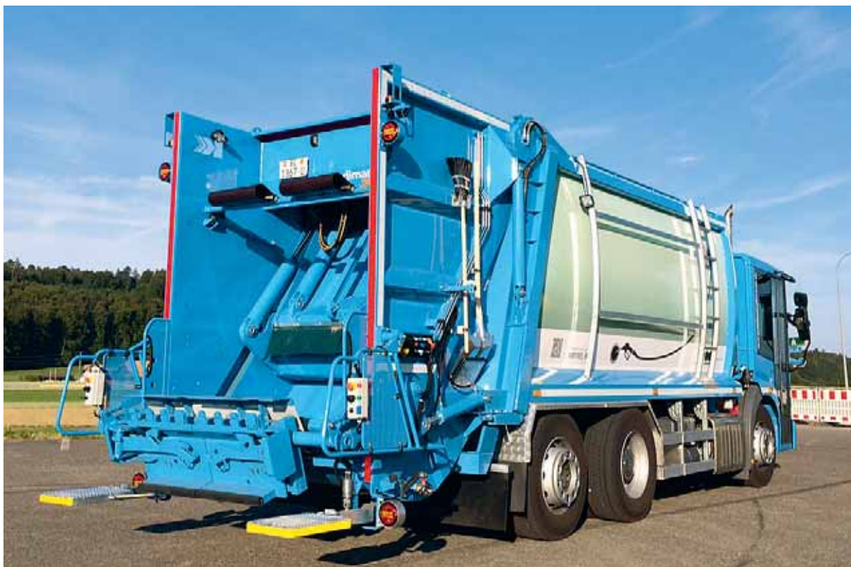
Dank Akku-Paket sammelt der Kehrichtwagen der Schwendimann AG Kehricht leise und effizient. Die Einsparungen an fossiler Energie kompensieren die Mehrkosten für den Akku.