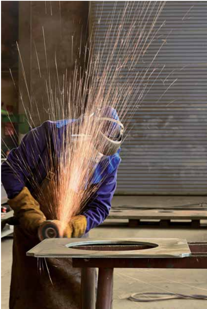
Steht bei einem KMU der Kauf einer neuen Maschine oder die Optimierung eines Prozesses an, unterstützen sie Reffnet-Experten dabei, die für das Unternehmen und die Umwelt optimale Lösung zu finden (Symbolbild).

machung der Angebote. Das Bundesamt für Umwelt begleitet und finanziert Reffnet.ch wesentlich.