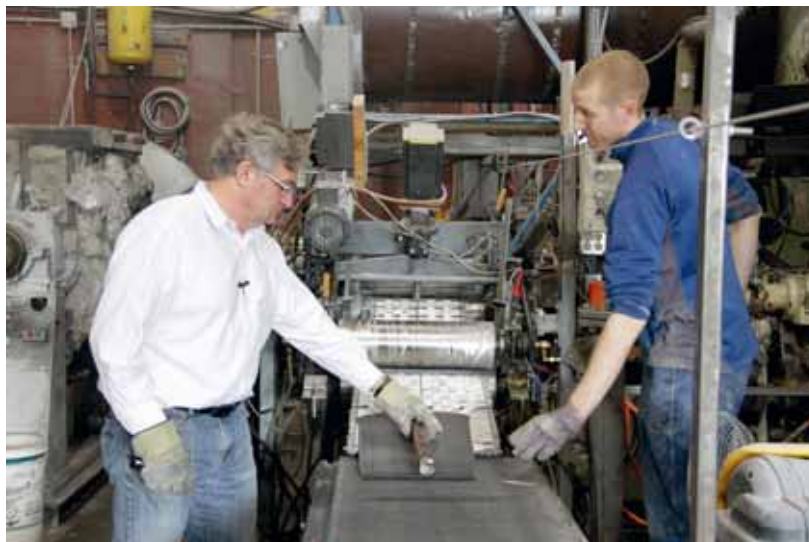
Erfahrene Experten des Netzwerks Ressourceneffizienz Schweiz setzen sich mit Schweizer Firmen an einen Tisch und durchleuchten den Betrieb auf die Möglichkeit, Material, Energie und Kosten einzusparen. Sie unterstützen auch bei der Umsetzung (Symbolbild).

Priska Messmer Pusch – Praktischer Umweltschutz Hottingerstrasse 4 Postfach 211, 8024 Zürich priska.messmer@pusch.ch www.pusch.ch www.reffnet.ch