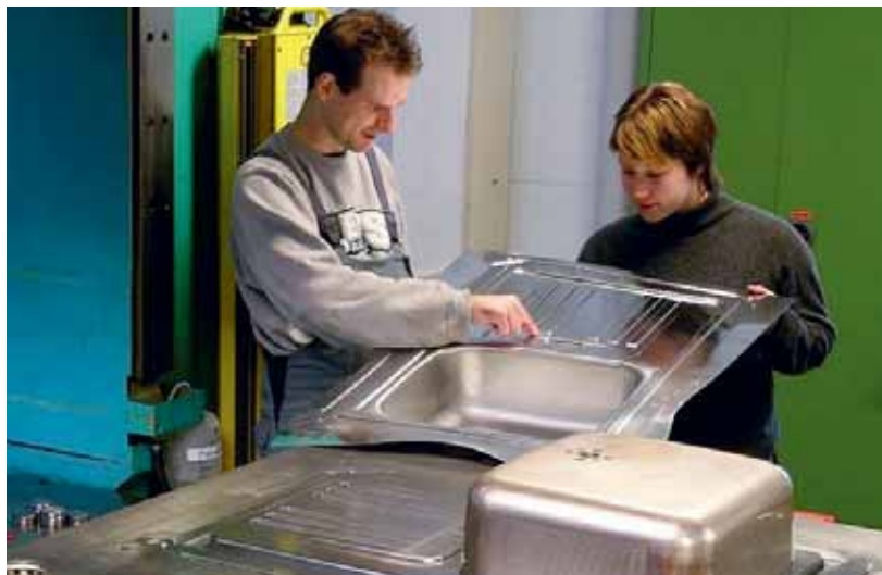
Mit dem neuen Ecodesign können riesige Mengen Chrom-Nickel Stahl sowie Energie eingespart werden, was die Kosten massiv reduziert.