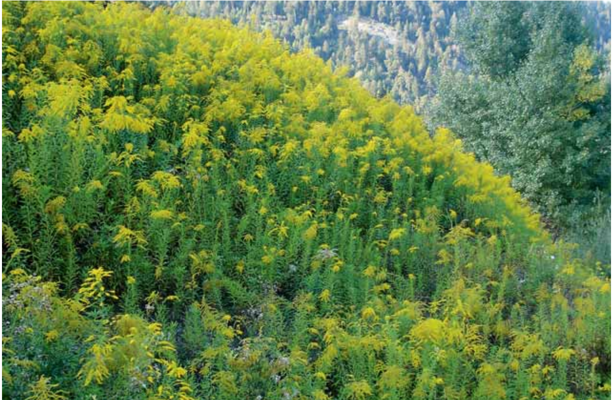
Die Kanadische Goldrute überwuchert vor allem auch wertvolle Schutzgebiete. Jeglicher Umgang damit, also auch der Verkauf, ist verboten. Auch als Schnittblume darf sie nicht in Verkehr gebracht werden, weil sich so Samen ausbreiten können.

Gärtnerei). Der Verstoß gegen die Beschriftungspflicht wurde jedoch häufig beobachtet und war deutlich abhängig von der Pflanzenart: Während beispielsweise die Kirschlorbeere in sieben von zehn Fällen korrekt beschriftet war, war dies für die Lupine (sechs Fälle) überhaupt nie der Fall (Grafik links). Der Wissensstand des Fachpersonals in den jeweiligen Betrieben war grundsätzlich akzeptabel. Sämtliche befragten Mitarbeiter kannten den Begriff der Schwarzen Liste und der Watch Liste. Auch dass die entsprechenden Pflanzen für den Verkauf beschriftet werden sollten, war bekannt. Die Kenntnis der einzelnen Pflanzen auf den entsprechenden Listen war jedoch mangelhaft. Vielen war nicht klar, dass neben dem Kirschlorbeer noch eine Vielzahl von weiteren Pflanzen in ihrem Sortiment beschriftet werden sollten. Hier besteht noch Handlungsbedarf. Eine Schwierigkeit, die im Vollzug häufig anzutreffen war, bildeten unvollständige Pflanzenbezeichnungen in den Verkaufsstellen. Anstatt des vollständigen botanischen Namens war häufig nur eine Sortenbezeichnung angegeben. Auch trafen wir immer wieder auf Pflanzenhybride, deren Abstammung nicht klar war. Diese Probleme werden laufend behoben, indem die gängig-