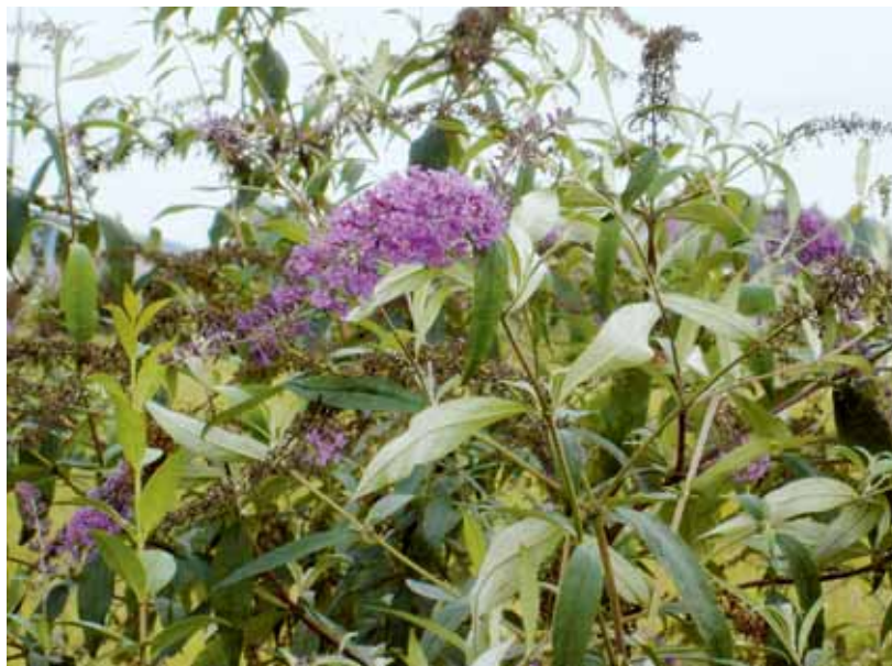
Der Sommerflieder verdrängt einheimische Futterpflanzen, die für Raupen wichtig sind. Er darf noch verkauft werden, die Blüten sollen aber noch vor dem Versamen abgeschnitten werden.