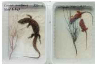
Reger Handel: Eine Vielfalt von Insekten, Spinnen und Reptilien werden an Tierbörsen angeboten.

Während bei invasiven Neophyten bereits erste Fortschritte erreicht worden sind, wie das Beispiel Kennzeichnungspflicht im Pflanzenhandel zeigt, steht der Vollzug bei gebietsfremden invasive Tieren (Neozoen) noch ganz am Anfang. Gemäss Freisetzungsvorordnung sind zwar der Ochsenfrosch, die Rotwangenschmuckschildkröte und der Asiatische Marienkäfer im Umgang verboten. Im Gegensatz zu den Neophyten existiert aber bei den Tieren noch keine Schwarze Liste oder Watchliste derjenigen Arten, welche bei uns Schaden anrichten können, falls sie in die Natur entkommen.