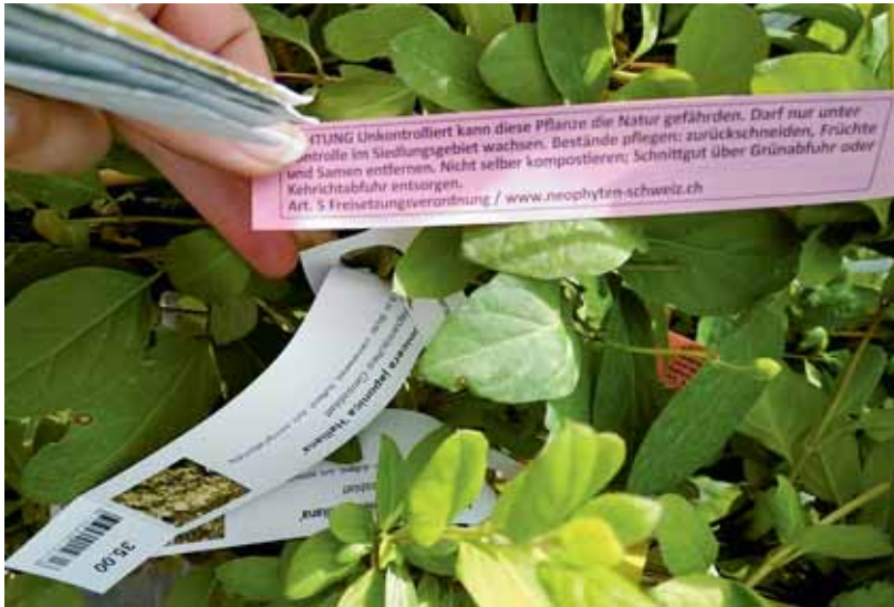
Nach Vorschrift beschriftetes Japanisches Geissblatt.

Anschliessend wurden konkrete Empfehlungen für die Umsetzung im Verkauf entwickelt. Insbesondere wurde auch eine Vorlage für eine Etikette entwickelt, die an jeder einzelnen Pflanze angebracht werden soll (Foto links). Schliesslich werden in einem letzten Schritt Unterlagen für den Vollzug erarbeitet mit dem Ziel, den Vollzug schweizweit zu harmonisieren.