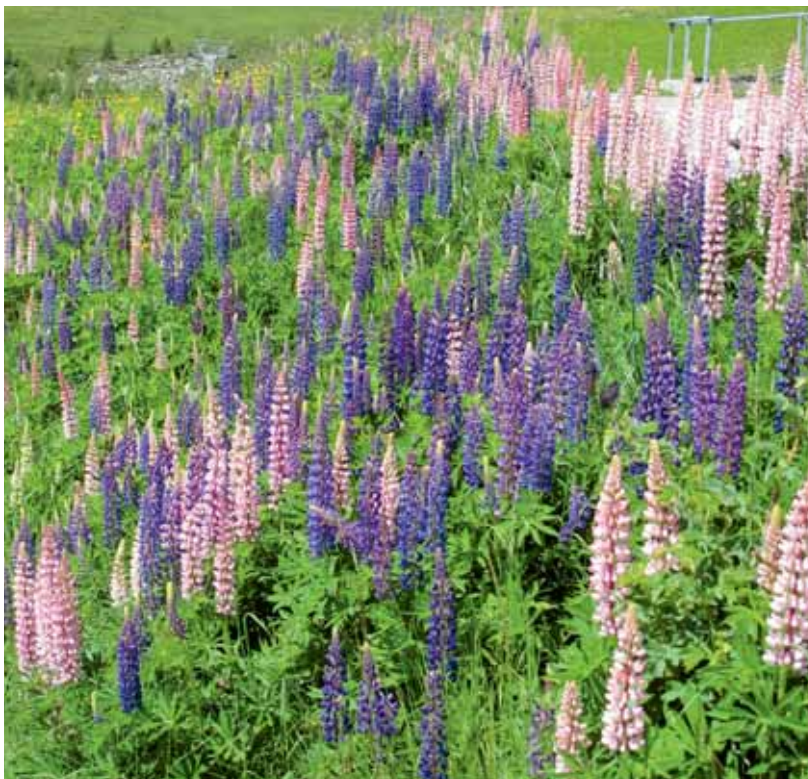
Bisher ist die Vielblättrige Lupine im Kanton Zürich noch kein grosses Problem. Die Pflanze muss jedoch im Verkauf speziell beschriftet werden, die Pflanze darf nicht in die Natur entweichen.

Zurzeit werden die Unterlagen für den Vollzug weiter ausgebaut und fortlaufend auf ihre Praxistauglichkeit überprüft. Zudem prüft man in der AGIN eine weitere Einschränkung von Arten, welche nicht mehr verkauft werden sollen. Kandidaten sind zum Beispiel der Götterbaum oder Henrys Geissblatt. Bei beiden ist auch bei intensiver Pflege kaum zu verhindern, dass sich Samen unkontrolliert in die Umgebung verteilen.