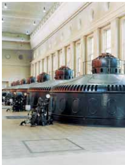
Die sieben Turbinen des Kraftwerks Eglisau Glattfelden nutzen das Gefälle des Rheins und treiben Generatoren an.

Wassernutzungsgebühren ein. Davon sind allein knapp acht Millionen Franken Gebühren für die Wasserkraftnutzung. Inhaltlich knüpfen die Vorschriften des Wassergesetzes im Bereich der Gewässernutzung an das bisherige Recht an.