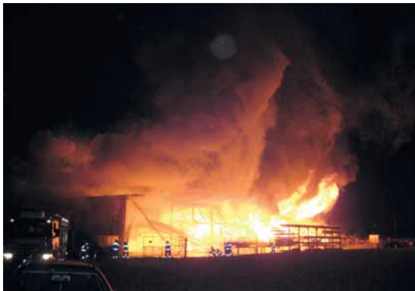
Verschmutztes Löschwasser muss aufgefangen und entsorgt werden. Im Bild: Brand einer Schreinerei in Wiesendangen.