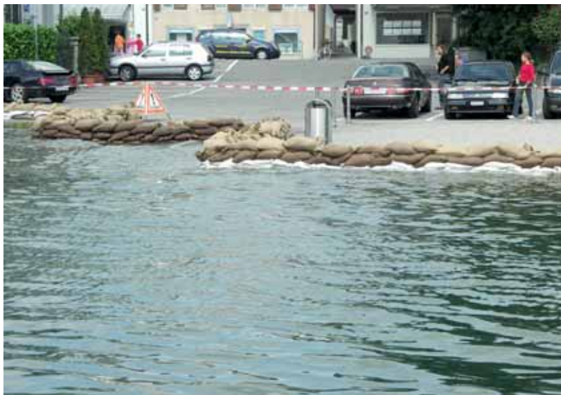
Bei den letzten, grossen Hochwasserereignissen vom Juli 2014 mit schweren Regengüssen im Einzugsgebiet von Sihlsee und Zürichsee dienten beide Seen als riesige Regenrückhaltebecken.