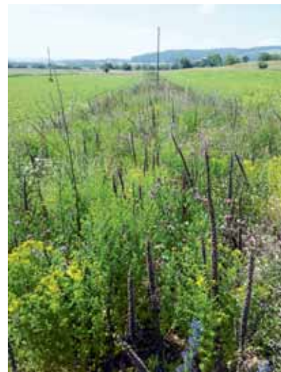
Biodiversitätsförderflächen im Ackerbau sind noch wenig verbreitet.