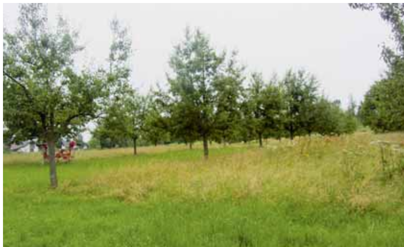
Diese Wiese in einem Obstgarten in Steinmaur wird gestaffelt geschnitten. Das hilft den Vögeln im Obstgarten, immer Nahrung zu finden.