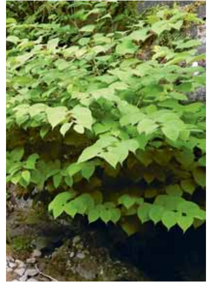
Strenge Auflagen regeln das Bauen auf Standorten mit Essigbaum (links) oder Japanknöterich (rechts), damit es nicht zur Bildung neuer Bestände kommt.

Asiatische Staudenknöteriche und Essigbäume sind invasive Neophyten, d.h. schädliche gebietsfremde Pflanzen. Der Asiatische Staudenknöterich zum Beispiel beschädigt mit seinen Rhizomen Bauwerke. Grosse Bestände können zu einer Destabilisierung der Uferläufe führen. Der Essigbaum verdrängt durch seine unkontrollierte Ausbreitung einheimische Arten.