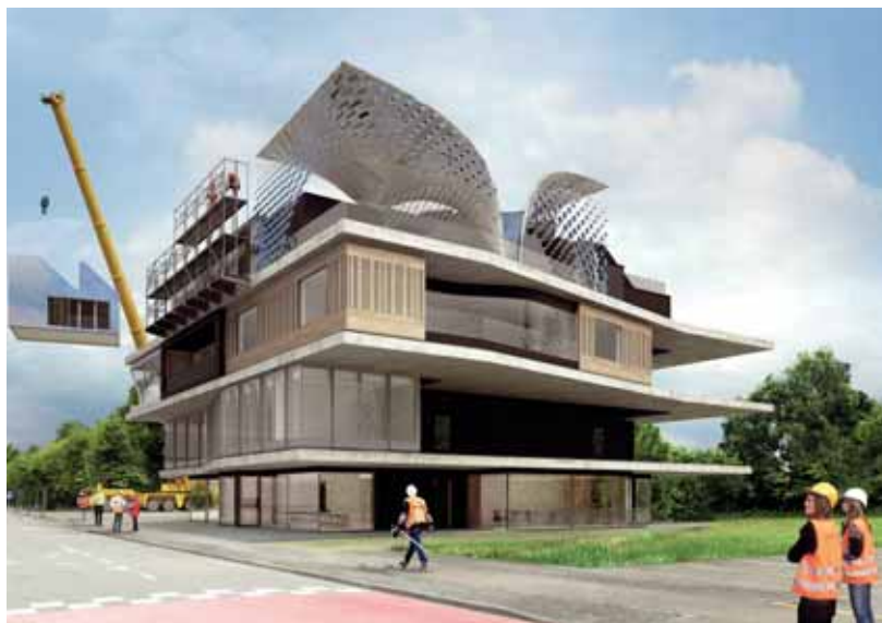
Visualisierung der Forschungsplattform für Gebäudetechnik (NEST) auf dem EMPA Campus in Dübendorf. Ein Projekt in Zusammenarbeit mit dem Kanton.