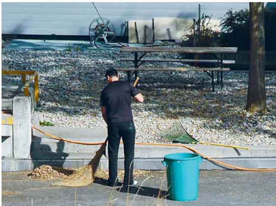
«Besen in die Hand nehmen statt Bläser umschnallen!» – für die Beurteilung und Beratung bei komplexeren Fällen von Alltagslärm wurde jetzt eine Vollzugshilfe samt Rechenwerkzeug entwickelt.