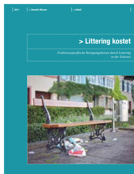
Die Studie «Littering kostet – Fraktionsspezifische Reinigungskosten durch Littering in der Schweiz» kann beim BAFU als PDF heruntergeladen werden: www.umwelt-schweiz.ch/uw-1108-d