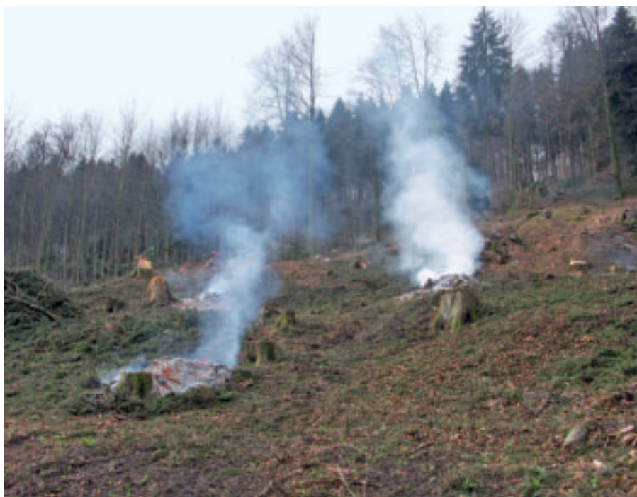
Im Winter verboten: Verbrennung von Schlagabraum.