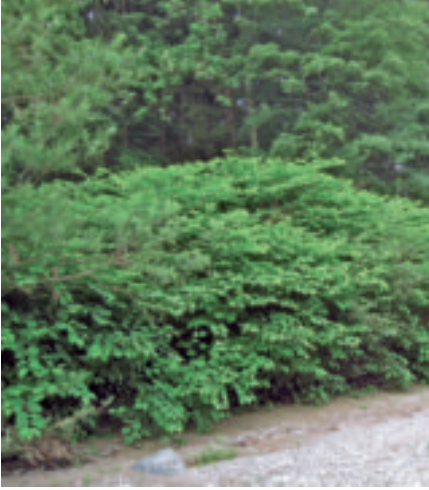
Japanknöterichbestand unterhalb Andelfingen (links). Aushub betroffener Flächen muss auf Rhizome des Japanknöterichs untersucht werden (rechts).