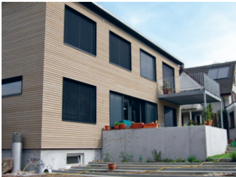
Mit Lamellen als aussenliegendem Sonnenschutz wird der Überhitzung von Gebäuden – auch bei Wohnbauten – entgegengewirkt.