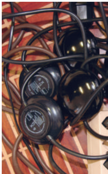
Hilfsmittel wie Stromsparmäuse schalten Geräte auch wirklich ab und verhindern so unnötigen Stromverbrauch. Hier vorgeführt an der «energyweek» 2008.

Die im Jahr 2005 vorhandenen zwei Erdgas- und drei Hybridfahrzeuge wurden in den vergangenen drei Jahren auf 18 Erdgas- und 16 Hybridfahrzeuge aufgestockt. Damit weisen bereits rund 5 % der kantonalen Personenwagenflotte einen alternativen Antrieb auf oder werden mit einem alternativen Treibstoff betrieben (zum Vergleich: gesamtschweizerischer Fahrzeugpark nur 0,45 %). Verglichen mit herkömmlichen Benzin- und Dieselfahrzeugen erspart die gesamte kantonale Erdgas- und Hybridflotte der Umwelt jährlich über 20 Tonnen fossiles CO 2 sowie beträchtliche