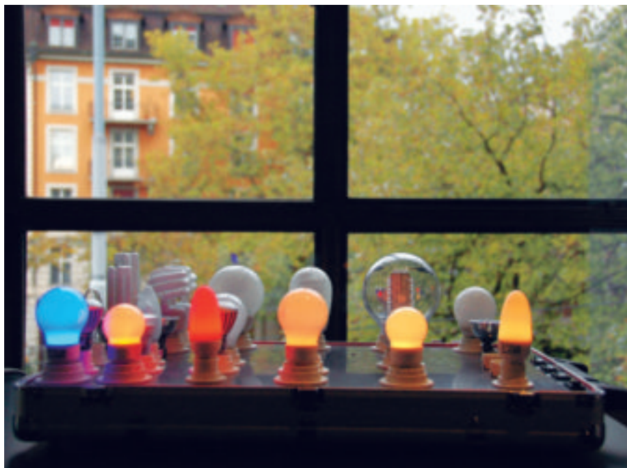
An der «energyweek» konnten die Ausstellungsbesucher sich unter anderem verschiedene Energiesparlampen anschauen und sich über mögliche Energieeinsparungen informieren.