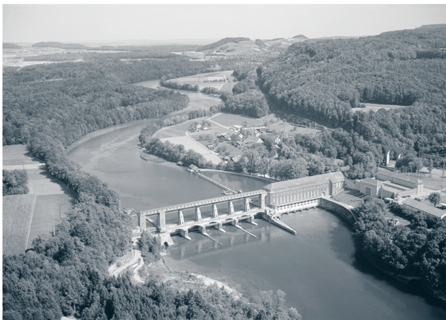
Das ökologische Potenzial der Wasserkraft ist im Kanton Zürich weitgehend ausgeschöpft. Im Bild: Kraftwerk Eglisau.