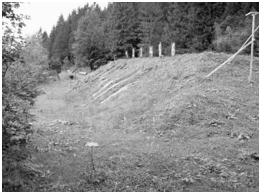
Typische Lage eines Kugelfangs am Waldrand.