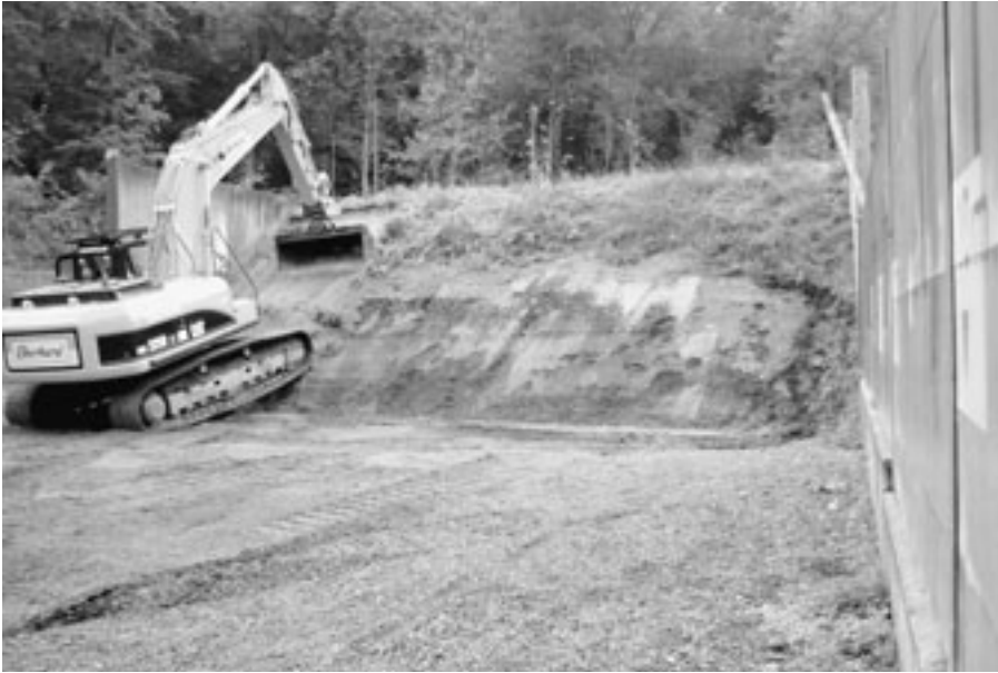
Werden Schiessanlagen stillgelegt, so verschwinden die Bodenbelastungen nur, indem sie ausgebaggert und fachgerecht entsorgt werden.