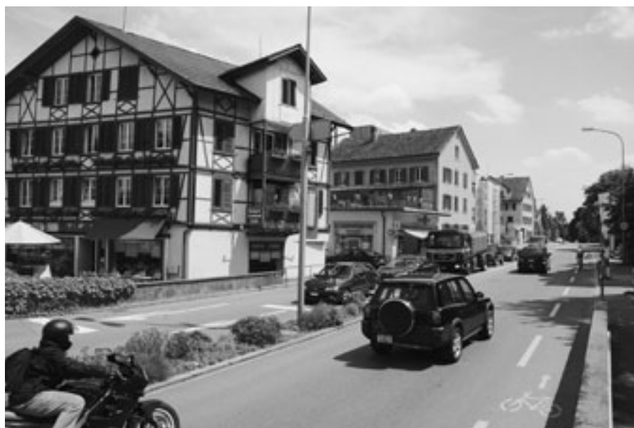
An der Fassade kommen keine modellierten Schallwellen an, sondern veritabler Strassenlärm. Messungen zeigen eine hohe Übereinstimmung des Modelles mit der Wirklichkeit (Kamerastandort: Siehe Pfeil in der Karte auf Seite 31).

Die Datenqualität der amtlichen Vermessungen wird zunehmend besser. Damit auch die Ergebnisse der Lärmberechnungen immer genauer werden können, wird der Kataster regelmässig aktualisiert. Der Lärmbelastungskataster wird so zu einem praktischen und unersetzlichen Hilfsmittel für eine erfolgreiche Planung und Umsetzung der Lärmsanierungen an den Strassen im Kanton Zürich.