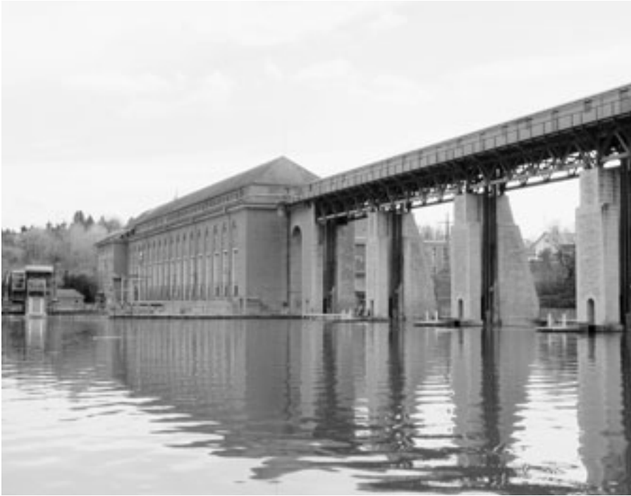
Bei Neukonzessionierungen von Wasserkraftwerken (im Bild: Kraftwerk Eglisau) ist die UVP in ein komplexes zweistufiges Verfahren eingebettet.