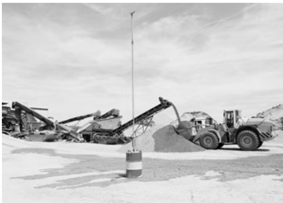
Bauschutt-Aufbereitungsanlage: Rund die Hälfte der UVP im Kanton Zürich betreffen Entsorgungs- und Parkierungsanlagen.