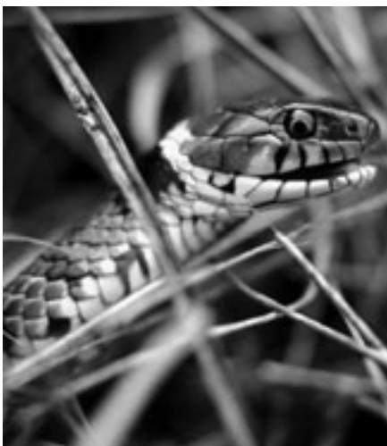
Die Ringelnatter lässt sich an Fliessgewässern erfolgreich fördern.