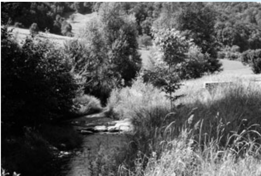
Fließgewässer bilden vielerorts das vernetzende Bindeglied zwischen wertvollen Ried- und Magerwiesen. Im Bild zu sehen ist die Reppisch.