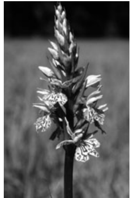
Das gefleckte Knabenkraut ist eine weitere mögliche Zielart für ein Vernetzungsprojekt.

Zur Festlegung des Raumbedarfs besteht eine einfache Methode. Sie ist für die kleinen bis mittelgrossen Fließgewässer anwendbar. Die massgebende Bezugsgrösse ist die «natürliche Gerinnesohlenbreite». Bei unverbauten Gewässern entspricht sie bei mittlerem Wasserstand etwa der Breite des Wasserspiegels. Bei verbauten Gewässerstrecken ist von der doppelten Breite des verbauten Gerinnes auszugehen (siehe Kasten oben). Die für die Funktionalität des Gewässers erforderliche Uferbereichsbreite beträgt bei kleinen und mittleren Gewässern je nach Gerinnesohlebreite beidseits des Gewässers 5 bis 15 Meter. Die Uferbereichsbreiten schliessen damit den von der Stoffverordnung entlang Oberflächengewässern geforderten minimalen Streifen mit dem Einsatzverbot von Düngern und Pflanzenbehandlungsmitteln von 3 Metern mit ein.