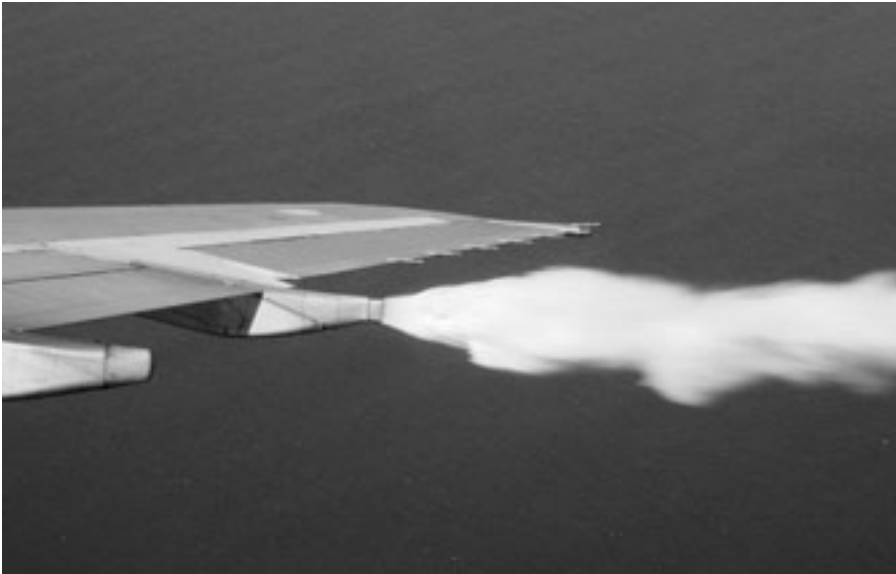
Fuel Dumping, der Ablass von Kerosin, ist eine seltene Sache.