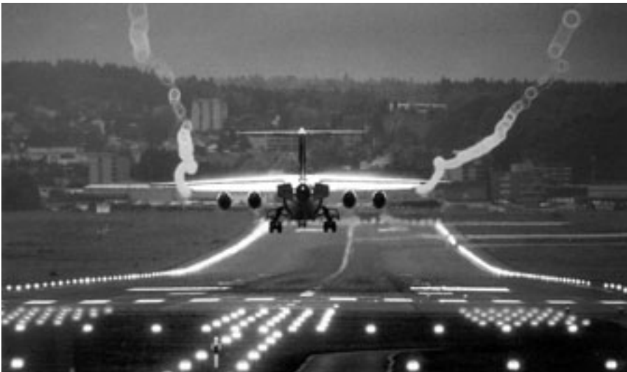
Randwirbelschleppen beim Landeanflug können leicht mit Fuel Dumping verwechselt werden.