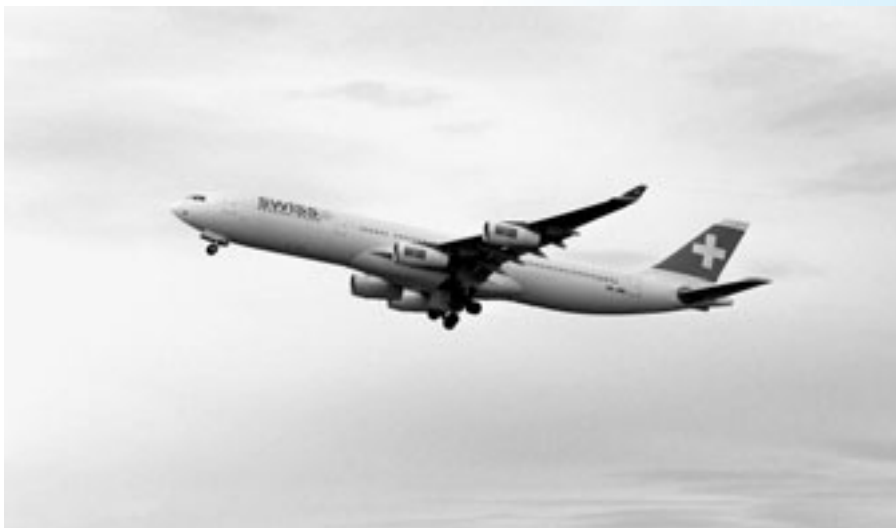
Wohin gehen die Flugzeug-Abgase?

Emanuel Fleuti Zurich Unique Airport Abteilung Umweltschutz 8058 Zürich Telefon 043 816 22 11 emanuel.fleuti@uniqueairport.com www.uniqueairport.com