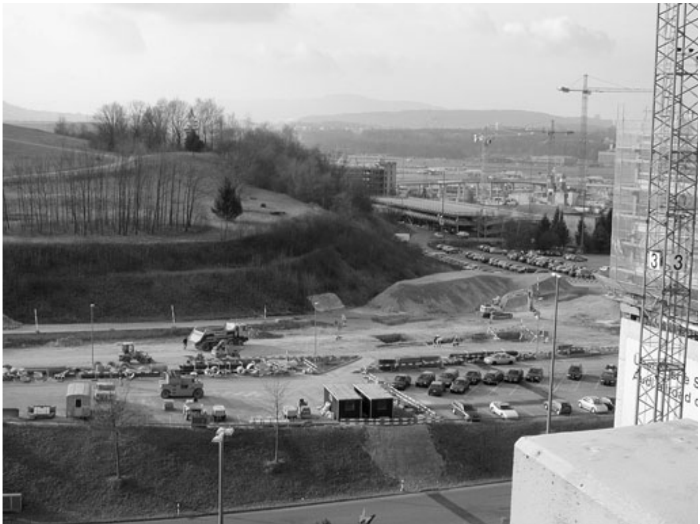
Die Auswirkungen des Flughafens werden an den Messstandorten vom Strassenverkehr überlagert, aber auch von grossen Bauarbeiten.