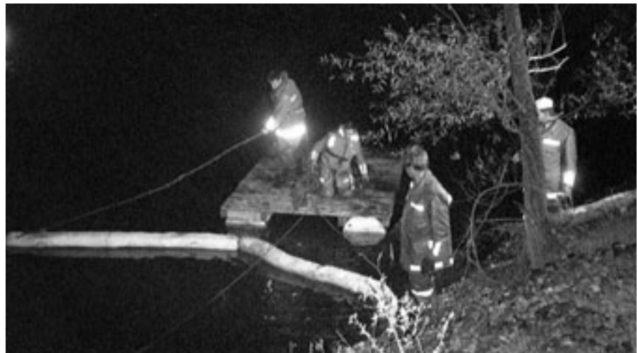
Schadenfälle können bei Tag oder Nacht passieren.