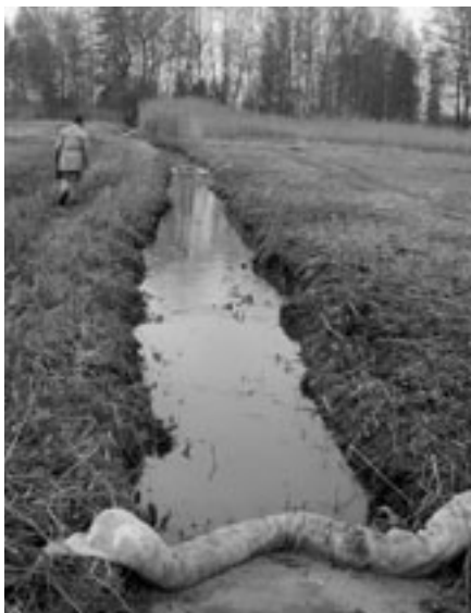
Bach mit Ölsperre.

Gerade Verunreinigungen des Trinkwassers können sich verhängnisvoll aus-