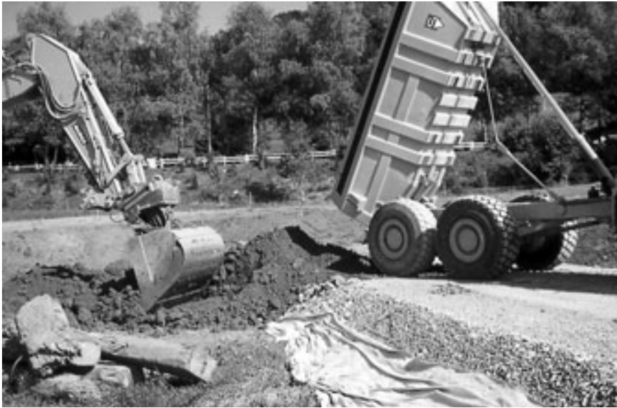
Kiespisten und Baggermatratzen schützen Böden vor Verdichtungen durch Befahren.