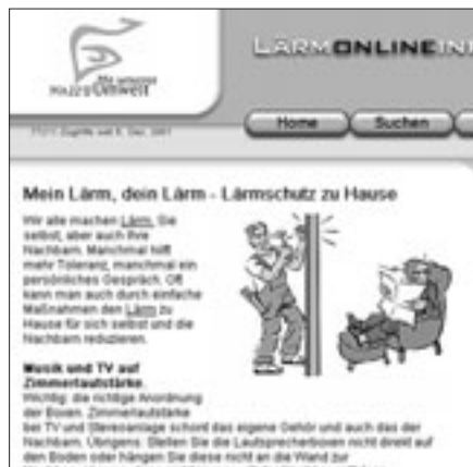
Wie informiert die Stadt Wien? Mit dem Lärm online Informationssystem LOIS.

Was machen diese Länder in Bezug auf die Lärmproblematik? Wie informiert zum Beispiel die Stadt Wien? – Mit dem gehaltvollen «Lärm Online Informations System LOIS» der Wiener Umweltschutzabteilung.