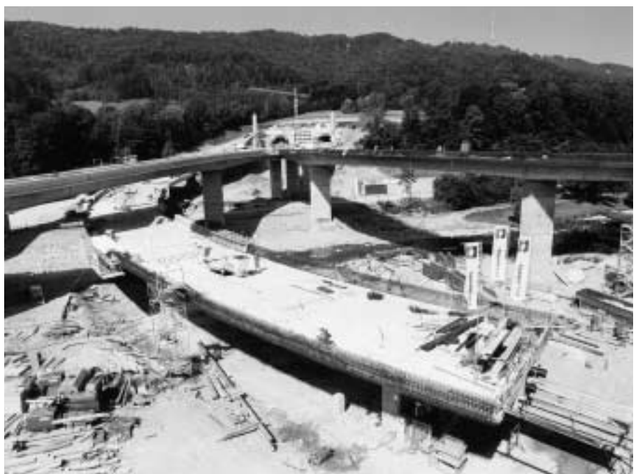
Bei den zürcherischen Nationalstrassen-Baustellen hat sich die Einsetzung einer ökologischen Begleitgruppe aus Vertreterinnen und Vertretern der zuständigen Umweltschutzfachstellen bewährt. So kann sichergestellt werden, dass die Auflagen aus dem UVP-Verfahren vollständig und korrekt umgesetzt werden.

Verfügungen mehrerer Behörden über eine Anlage inhaltlich aufeinander abzustimmen. Sie hat dafür zu sorgen, dass die