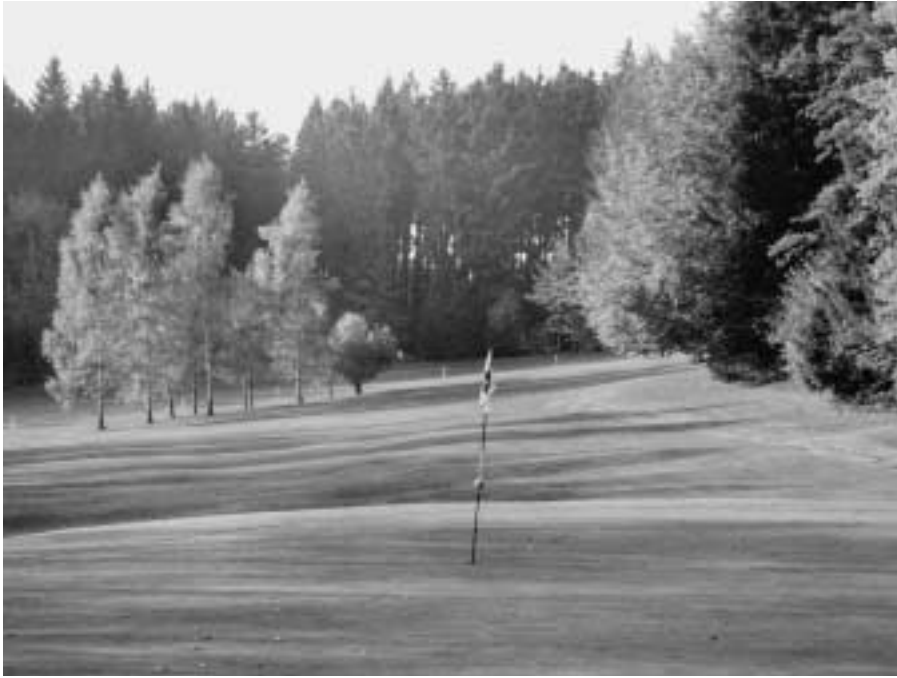
Golfplätze müssen auf ihre Umweltverträglichkeit geprüft werden.