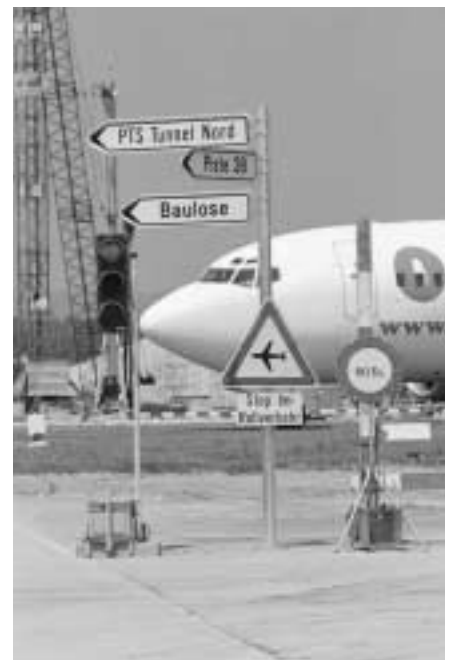
Ein positives Beispiel für die Einhaltung von Umweltauflagen ist das im Rahmen der 5. Ausbaustappe des Flughafens Zürich eingeführte «Umwelt-Controlling».