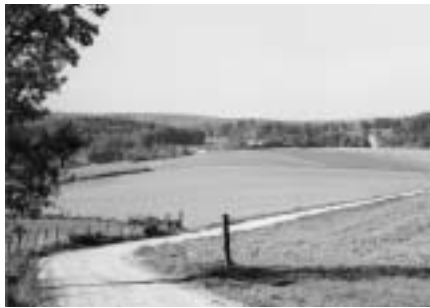
Zusammengelegte Parzellen in Damphreux.

Das Verbandsbeschwerderecht steht den Natur- und Heimatschutzorganisationen wegen ihrer ideellen Zielsetzung und wegen des öffentlichen Interesses an der Durchsetzung des Natur-, Heimat- und Umweltschutzrechtes zu. Die Erfolge in den vergangenen Jahrzehnten zeigen, dass es sich um ein sinn- und wirkungsvolles Instrument handelt. Trotzdem – oder gerade deshalb – wird aus gewissen Kreisen mit unhaltbaren Argumenten den Umweltorganisationen der Missbrauch des Beschwerderechtes vorgeworfen. Der Schweizer Heimatschutz SHS zeigt mit einem neuen Kodex, dass er vom Verbandsbeschwerderecht verantwortungsbewusst Gebrauch macht. Der Kodex stellt die Unabhängigkeit des SHS sicher und verhindert einen Missbrauch des Beschwerderechtes. Er wird die Praxis des SHS nur in wenigen Fällen ändern. Beschwerden werden auch in Zukunft dann erhoben, wenn gültiges Recht nicht zur Anwendung gelangt und die Interessen des Natur- und Heimatschutzes auf der Strecke bleiben.