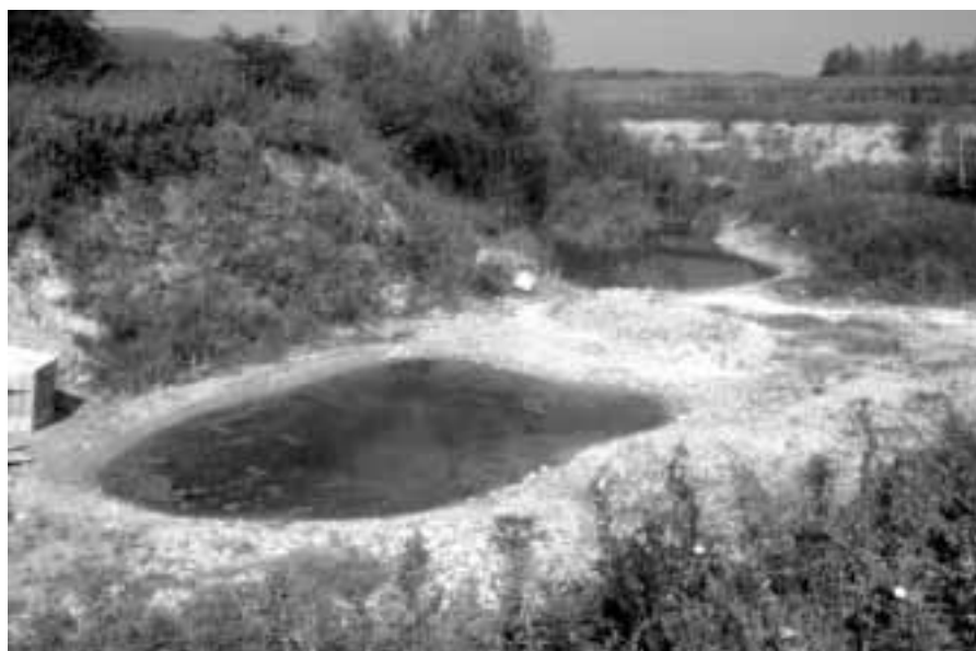
In der ehemaligen Kiesgrube Chrumben in Flaach wurden neue Weiher und Tümpel angelegt und ein alter, stark zugewachsener Weiher ausgeräumt.

Lichte Wälder beherbergen eine grosse Zahl von Pflanzen- und Tierarten. Sie zeichnen sich aus durch einen geringen Holzvorrat, weshalb sie bis auf den Boden gut besonnt werden. Einige sehr seltene Pflanzen bevorzugen diesen Lebensraum, so z.B. die Küchenschelle ( Pulsatilla vulgaris ) und die Astlose Graslinie ( Anthericum liliago ). Lichte Wälder finden sich natürlicherweise kleinflächig auf extrem