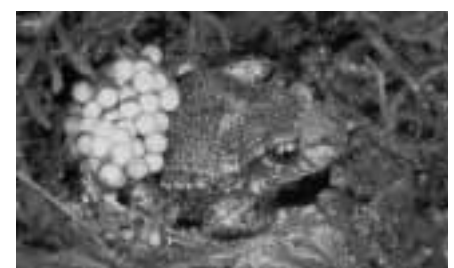
Die Geburtshelferkräuter konnte bis anhin nicht von den getroffenen Massnahmen profitieren.