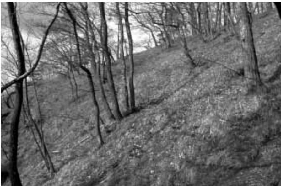
Typisch für lichten Wald ist die gut ausgebildete Krautschicht, in der viele lichtbedürftige, meist seltene Pflanzenarten gedeihen können.