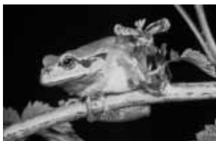
Der Laubfrosch reagierte sehr positiv auf die Aufwertungsmassnahmen.