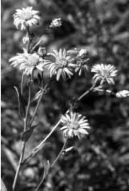
Die Berg-Aster ( Aster amellus ) profitiert stark von den Auflichtungsmassnahmen. Sie konnte ihr Vorkommensgebiet mit deutlich mehr Trieben ausdehnen.