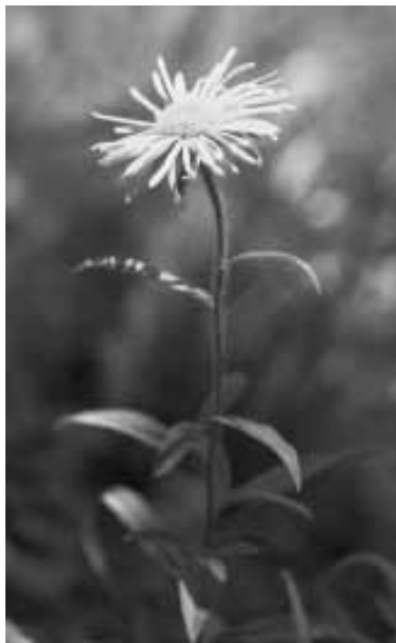
Der sehr seltene Rauhe Alant ( Inula hirta ) gedeiht in Trockenwiesen und lichten Wäldern. Seine positive Reaktion auf geeignete Fördermassnahmen lässt sich mit Erfolgskontrollen nachweisen.

und gehörten Tiere werden während drei Begehungen zwischen März und Juni pro Art gezählt. Aufgrund dieser Daten wird anschliessend geschätzt, wie gross die einzelnen Populationen sind. Regelmässig überprüft wird auch die Wasserführung der Gewässer.