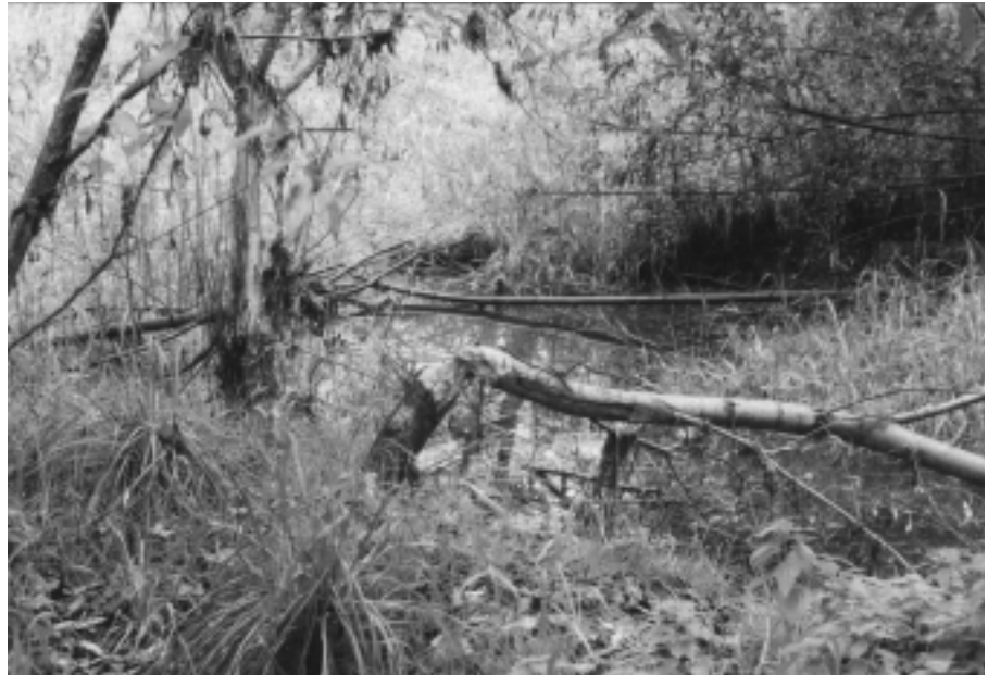
Biberspuren am Binnenkanal.

Für Korrektionsprojekte sind auf beiden Seiten der Thur unterschiedliche Vorgehen nötig. Während im Kanton Zürich das Land an der Thur bereits im Staatseigentum ist, gehört es im Thurgau mehrheitlich Privaten. Der Kanton Zürich kann die Arbeiten an der Thur im Rahmen des Unterhalts planen und finanzieren, während im Thurgau ein eigentliches Korrektionsprojekt mit Auflage, Einspracheverfahren und Zustimmung aller Beteiligten nötig ist. Im Thurgau musste also das Gesamtprojekt mit Budget zuerst