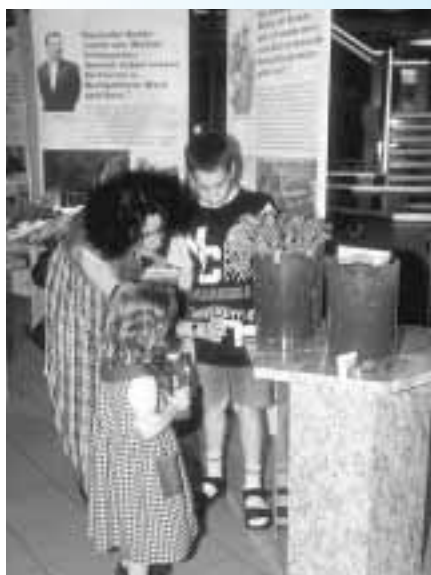
Die breit abgestützte Aktion «Erlebnis Boden» unterstützt lokale Akteure bei der Informations- und Beratungsarbeit.

Zur Wanderausstellung gehören neben Informationsfahnen, Broschüren und Hilfsmitteln für lokale Aktionen verschiedene Erlebnisobjekte. Sie zeigen prak-