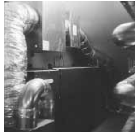
Kontrollierte Lüftung: Ventilator und Wärmetauscher (unten) und Bypass (oben).

Eine kontrollierte Lüftung versorgt die Nutzer mit Frischluft. Die Zuluftleitung führt unter der Bodenplatte durch, was zu einer leichten Vorerwärmung der