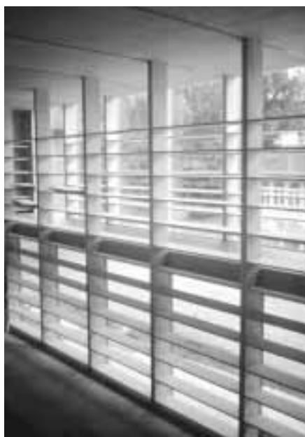
Blick ins Innere der neuen Mediathek: Bücherregale bilden die Tragstruktur.

Der Glasaufbau ergibt einen U-Wert von 0,4 W/m 2 K und einen g-Wert (Gesamtenergie-Durchlassgrad) von 26 Prozent. Der U-Wert der Fenster inklusive Holzrahmen beträgt nur 0,54 W/m 2 K. Er