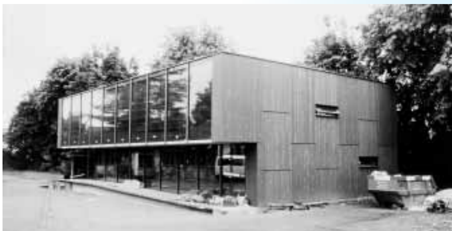
Mediothek der Kantonsschule Küsnacht (Architekten: Bétrix und Consolascio).