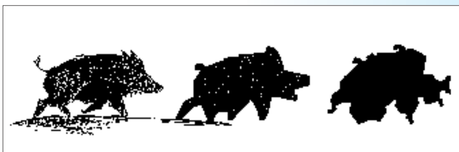
Das WILDSCHWEIN auf dem Weg zurück in die WILDSCHWEIZ