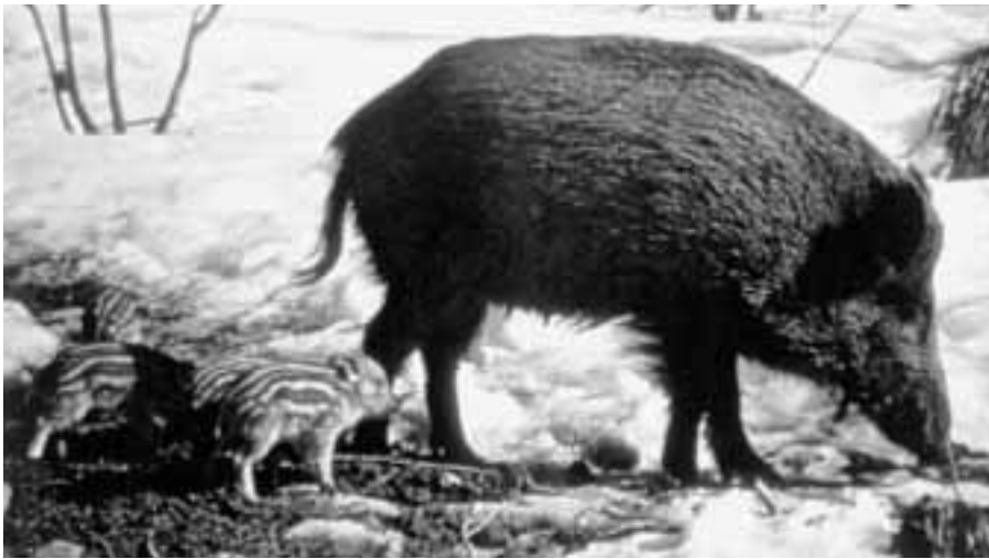
Im Kanton Zürich sind immer häufiger Muttersauen und ihre gut getarnten Frischlinge anzutreffen.