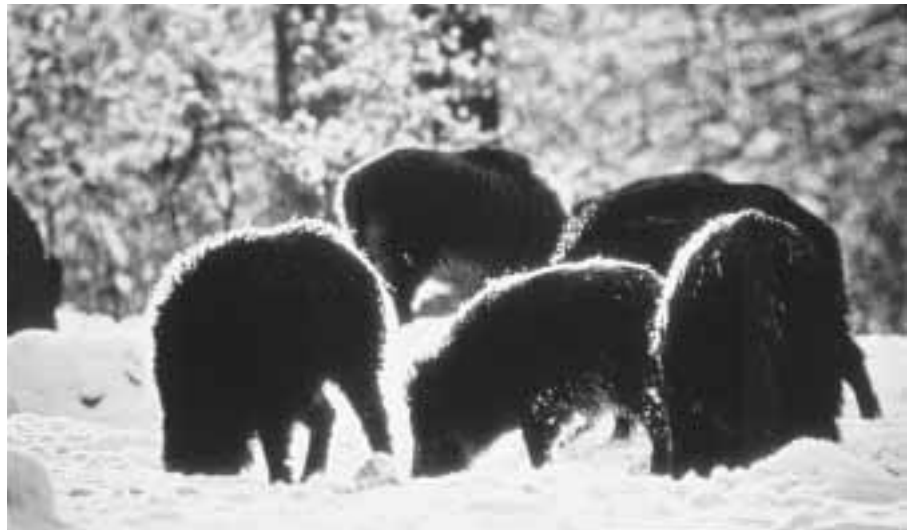
In Rotten bis zu 40 Tieren erobert das Wildschwein zur Zeit das Mittelland.

Eigentlich sprechen mindestens die folgenden drei Entwicklungen heute gegen eine Verbreitung der Tiere: