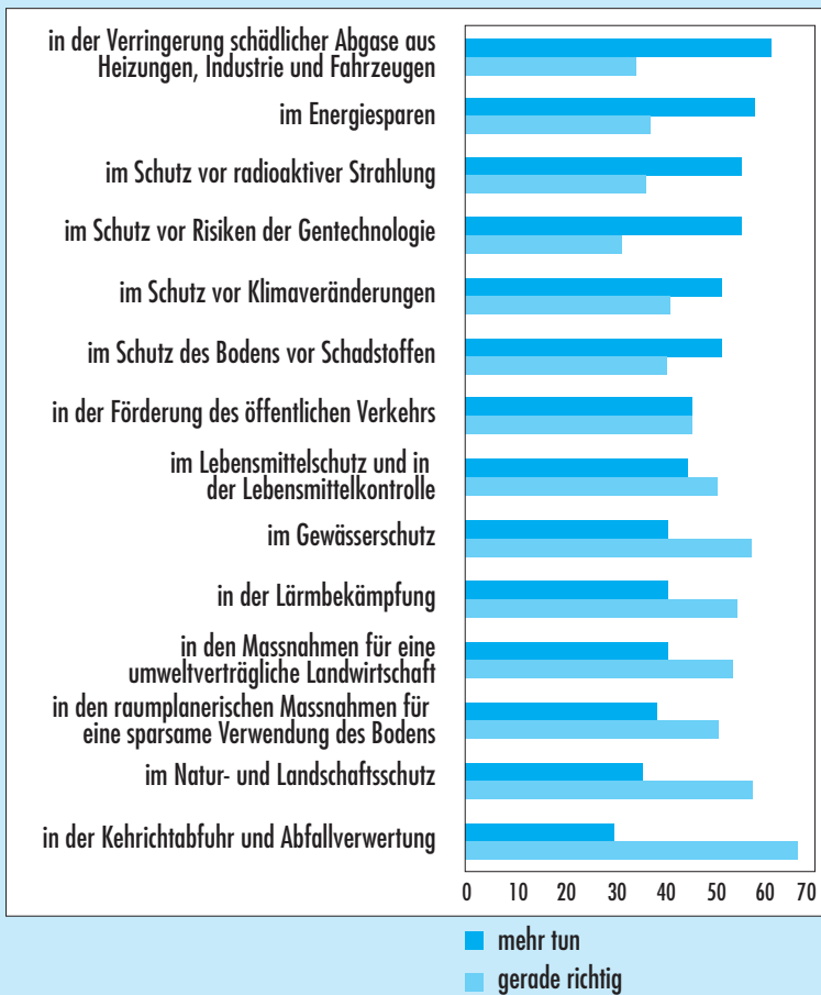
Meinungen zum Handlungsbedarf in verschiedenen Bereichen des Umweltschutzes

«(...) In welchen Bereichen müssten die Behörden Ihrer Meinung nach künftig mehr tun, wo handeln sie gerade richtig und wo sollten sie weniger tun?» (in Prozent der Befragten)