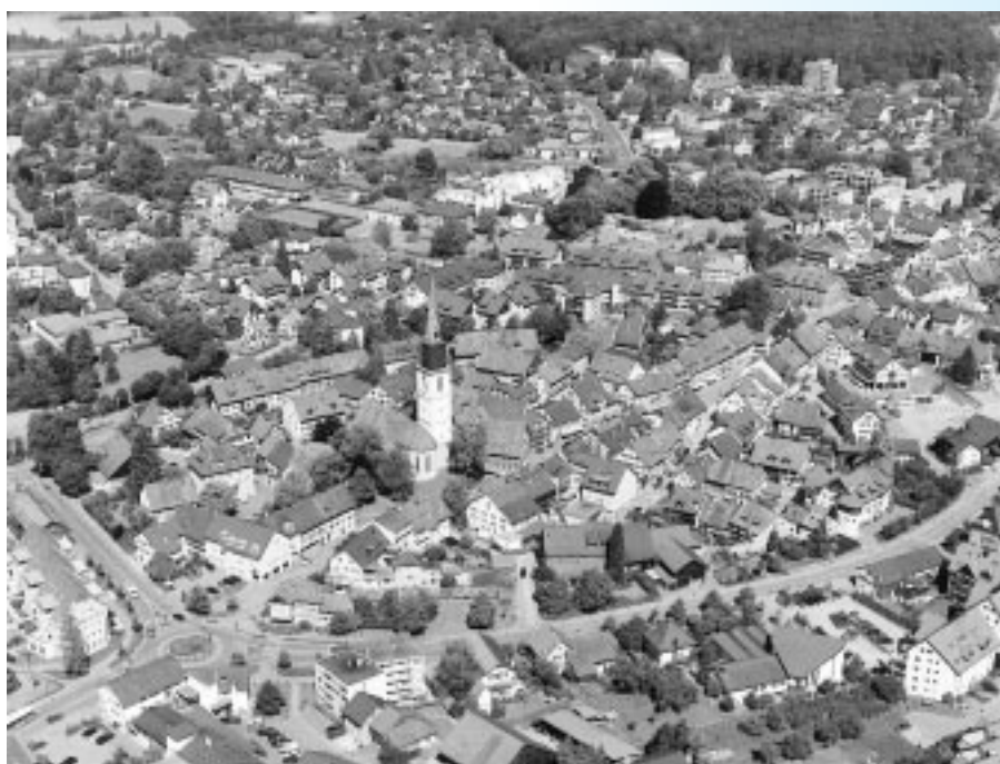
Bülach wurde im März 1999 zur jüngsten Energiestadt des Kantons Zürich.

Redaktionelle Verantwortung für diesen Beitrag: Energie 2000 für Gemeinden Giuseppina Togni Leiterin Region Ost-Schweiz c/o eTEAM GmbH Nordstrasse 31 8006 Zürich Telefon 01 / 360 16 94 Telefax 01 / 360 16 95 E-Mail: eteam@access.ch http://www.energie2000.ch http://www.energiestadt.ch