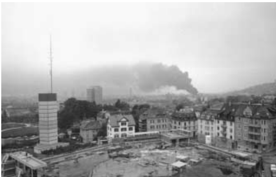
In unseren modernen Lebensräumen mit ihrem Nebeneinander unterschiedlichster Nutzungen können sich Menschen durch Luftverunreinigungen vielfältigster Art gestört und belästigt fühlen – auch ohne einen Stör- oder Brandfall.

Vom Schlachten bis zum verkaufsfertigen Produkt können bekanntlich bei der Fleischverarbeitung die verschiedenartigsten, nicht immer angenehmen Gerüche entstehen, darunter insbesondere die äusserst lästigen, die durch Gärprozesse im Abwasser, von den Konfiskaten (nicht zum Verzehr geeigneten Teilen der Schlachttiere) und bei der Fettverwertung verursacht werden. Gemäss verlässlichen Angaben – Klagen über Jahrzehnte! – von Anwohnern hat sich die Situation um den Schlachthof Zürich zwar langsam, aber stetig verbessert. Komplex ist der Fall auch deshalb,