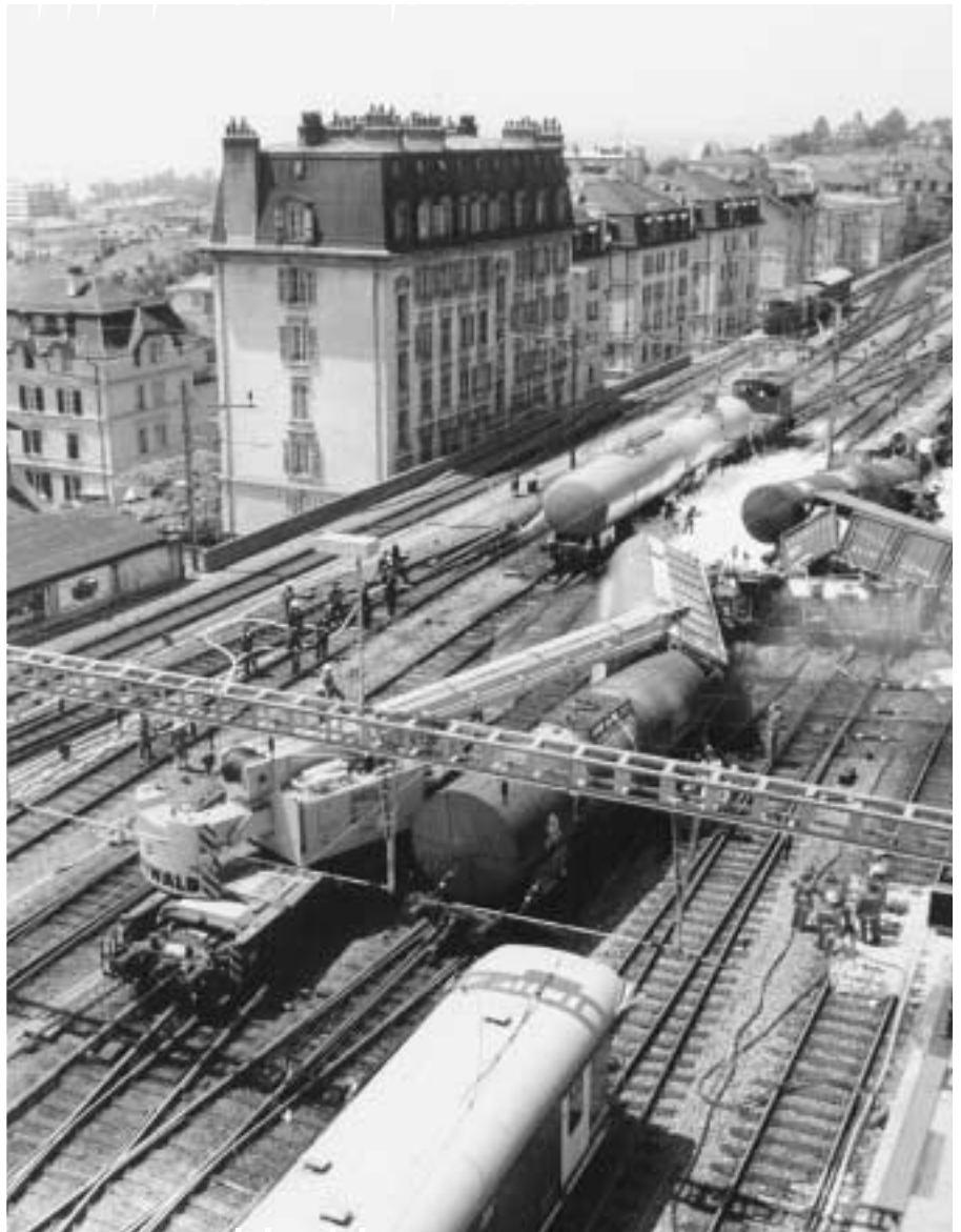
Störfall im Bahnhof Lausanne: Unfallort mitten im Stadtzentrum und Kühlen von Kesselwagen

Da die Temperaturen entsprechend der Jahreszeit zur Unglückszeit hoch waren, zwang die virulente Explosionsgefahr zur sofortigen Evakuierung von etwa tausend Bewohnern in der Nachbarschaft. Ein zusätzliches Risiko stellte das in einem ebenfalls entgleisten, aber dicht gebliebenen Wagen vorhandene, im Kontakt mit dem Epichlorhydrin ebenfalls hochgiftige und explosive Thionylchlorid dar.