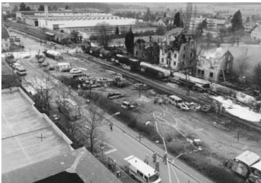
Störfall Affoltern: Feuerwehr im Einsatz und nach dem Löschen