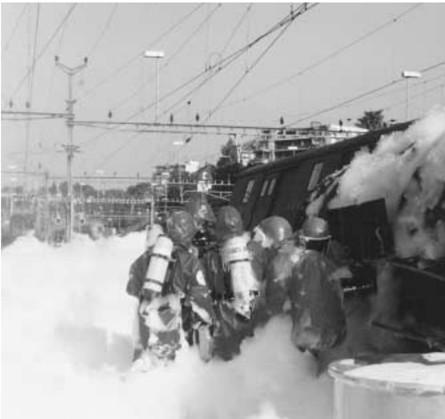
Umfüllen beschädigter Kesselwagen und Abdecken mit Schaum