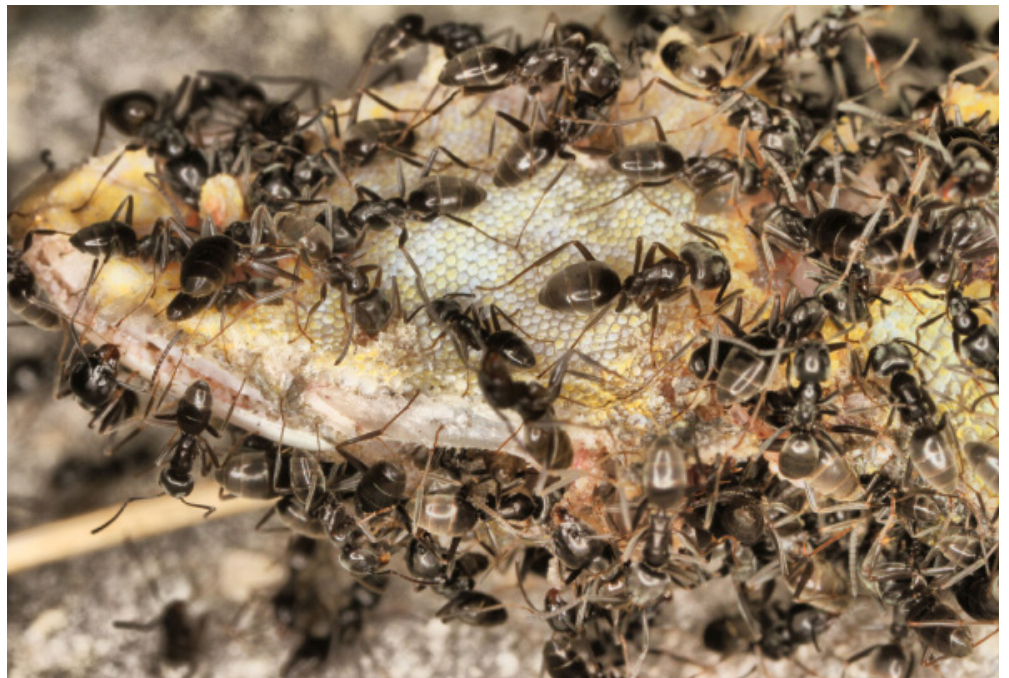
Invasive Ameisen können bei Bauarbeiten verschleppt werden. Einmal etablierte Bestände sind sehr schwer zu bekämpfen (im Bild Tapinoma magnum).

Ausbreitung Wie breiten sich Ameisen aus? Bei beiden Arten fliegen die Königinnen nicht aus, sondern wandern aus der bestehenden Kolonie ab. Dadurch verbreiten sie sich wesentlich langsamer als ihre geflügelten Artgenossen. Der Hauptverschleppungsweg ist mittels Topf- und Gartenpflanzen oder Erdmaterial, das vom Menschen verschoben wird. Daher ist es auch so wichtig, bei Abtransport und Entsorgung von Material aus Befallsgebieten besonders vorsichtig zu sein. Es reicht eine unentdeckte befruchtete Königin, um diese Ameisen in ein neues Gebiet zu verschleppen.